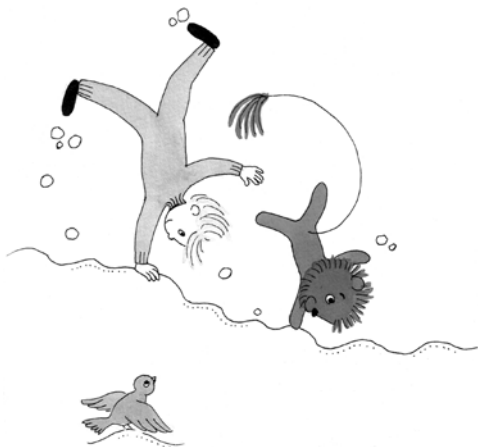
LACI ÉS AZ OROSZLÁN

Átélnem a technikai haladás szédítő teljesítményeit – mindig új meg új csodának örvendezve, s ma már magától értetődő természetességgel írom és küldöm leveleimet a számítógépen a Föld túlsó oldalára.