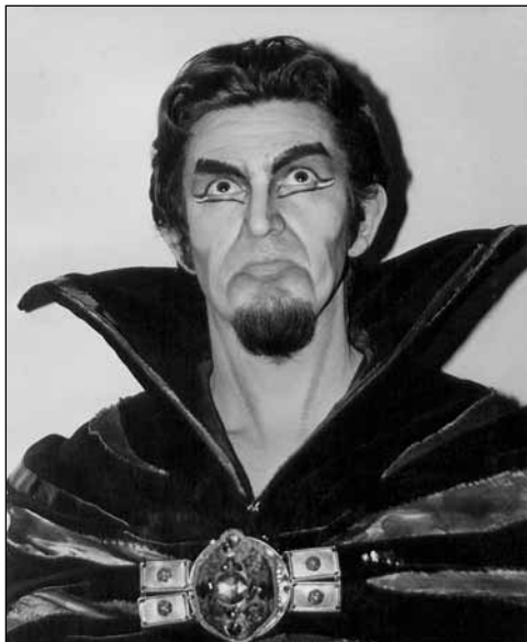
MEPHISTO (FAUST) GOUNOD OPERÁJA

föld(jegyű)-vonzatú munka és alkotás jelképe. A lovasberényi évekkkel (Budapestnek végleg búcsút intve) az utóbbinak jött el az ideje. Mindig érdekelt a néprajz, az organikus kultúra. Szeretem a földet, a növényeket, állatokat, s ma már elképzelni se tudnám léteemet a berényi kétszáz éves parasztházam, gyümölcsfáim, szőlőültetvényem nélkül. A sokak által még ma is földtúrónak csúfolt paraszti közösség, a kétkezi munka, az egyéni gazda önállóságának hagyományát sugárzó ősi ház felszabadította bennem a szunnyadó reneszánsz képességeket. Anyai őseim „génhíradóként” testesültek meg a kezem alól kikerülő faragványokban, szobrokban, kis-