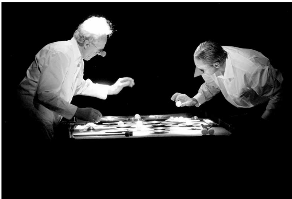
UTOLSÓ TÁJKÉP (NAGY JÓZSEF DÍJAZOTT DARABJÁBÓL)