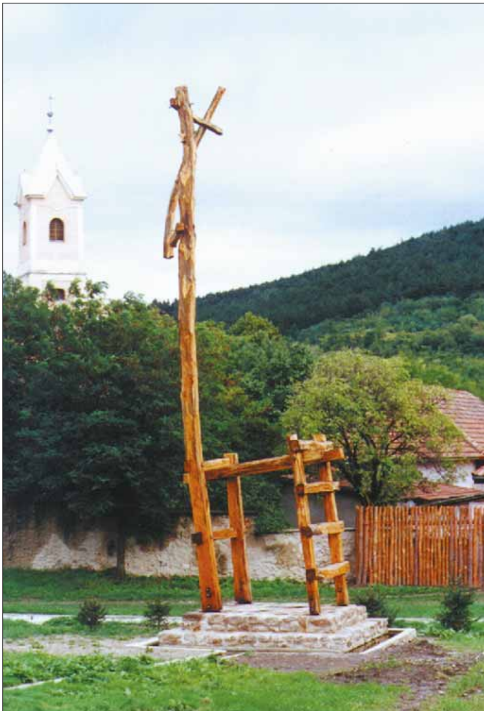
ZÁSzlós SZÉK (FONY)