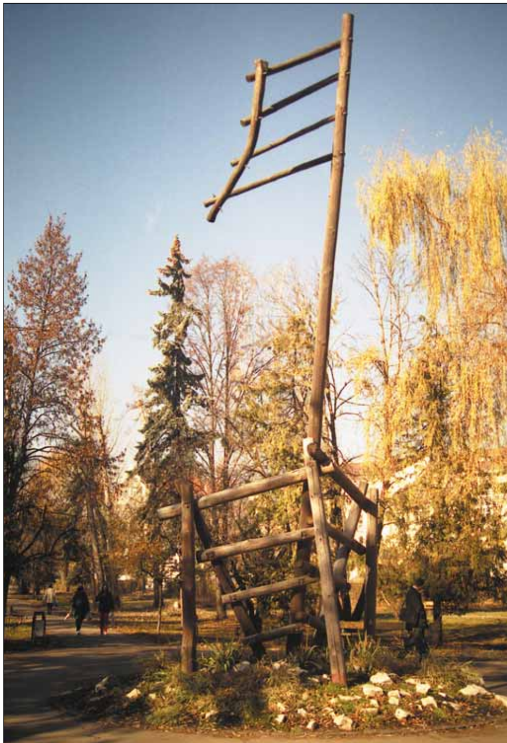
CSÍKI SZÉK (CSÍKSZEREDA)