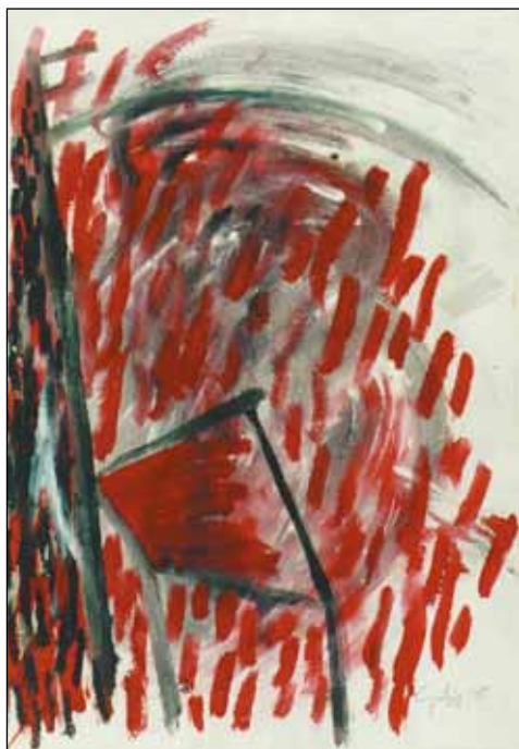
A TŰZES SZÉK