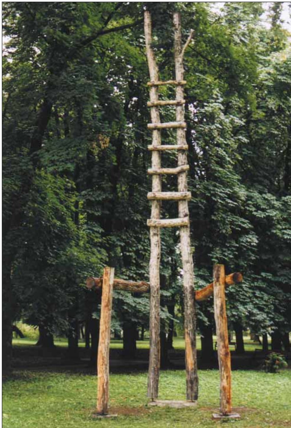
SZÉKELY SZÉK (SZÉKELYUDVARHELY)