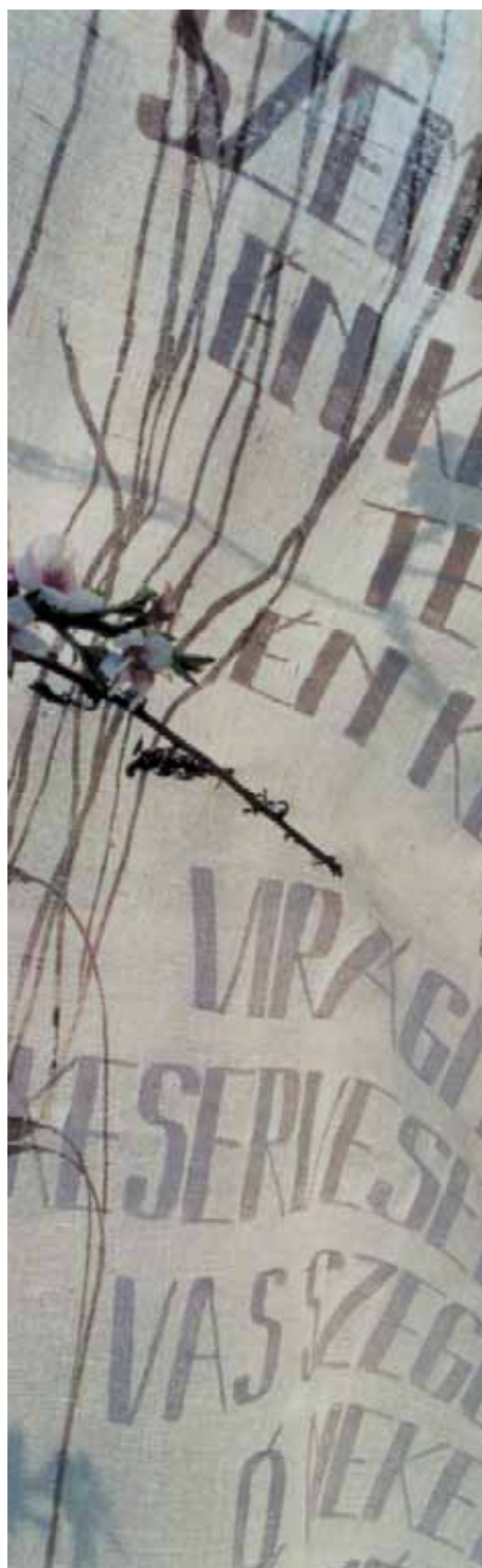
AZ „ÓMAGYAR MÁRIA-SIRALOM” 2005 HÚSVÉTJÁN (RÉSZLETEK)