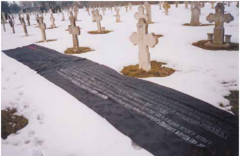
„HALOTTI BESZÉD ÉS KÖNYÖRGÉS” (2000) A MINDSZENTI HŐSI TEMETŐBEN 2004 TELÉN