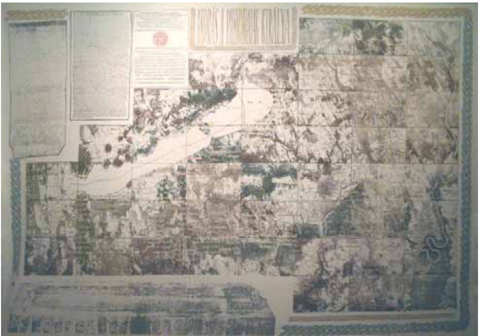
„TIHANYI ALAPÍTÓLEVÉL – TÉRKÉPEN” (2003)