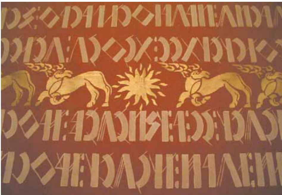
„SZENT ISTVÁN INTELMEI” – ROVÁSÍRÁSSAL (RÉSZLET) (1993–1996)