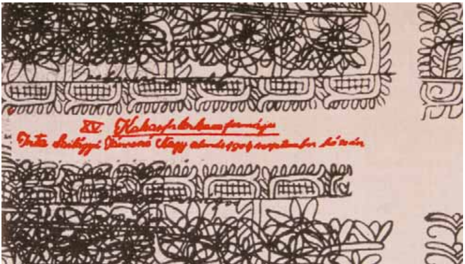
LEVNÁSZON DRAPÉRIA KALOTASZEGI ÍRÓASSZONY MINTARAJZÁNAK FELHASZNÁLÁSÁVAL; KÉSZÜLT AZ 1980-AS ÉVEKBE