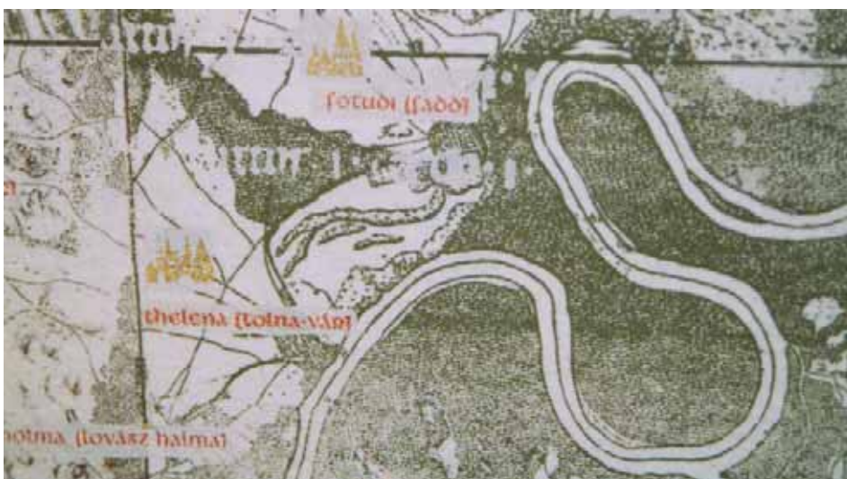
A 950 ÉVES ALAPÍTÓLEVÉLBE SZEREPLŐ HELY- ÉS HATÁRPONTOK AZONOSÍTÁSA (RÉSZLETEK)