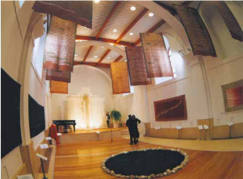
KIÁLLÍTÁS SÁROSPATAKON A MÚZSÁK TEMPLOMÁBAN NEMZETI MÚZEUM RÁKÓCZI MÚZEUMA (2005. MÁJUS–JÚLIUS)