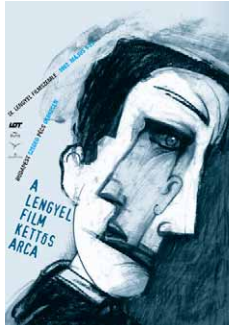
KRZYSZTOF DUCKI (MAGYARORSZÁG) A LENGYEL FILM KETTŐS ARCA