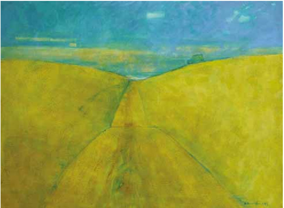
TADEUSZ Z. BŁOŃSKI (SZLOVÁKIA) EGYENESEN