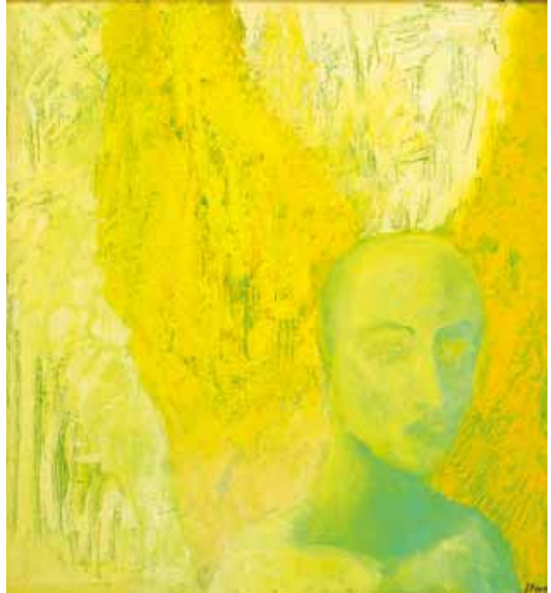
XENIA BERGEROVÁ (SZLOVÁKIA) ANGYAL