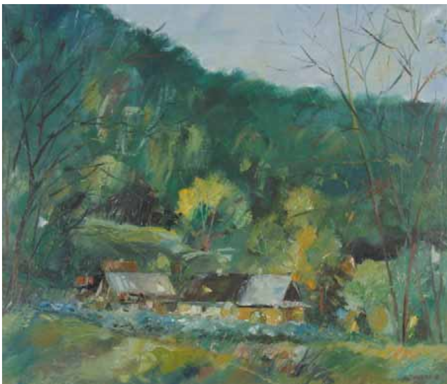
OSKAR PAWLAS (CSEHORSZÁG) BESZKIDEK, ŁOMNA GÓRA