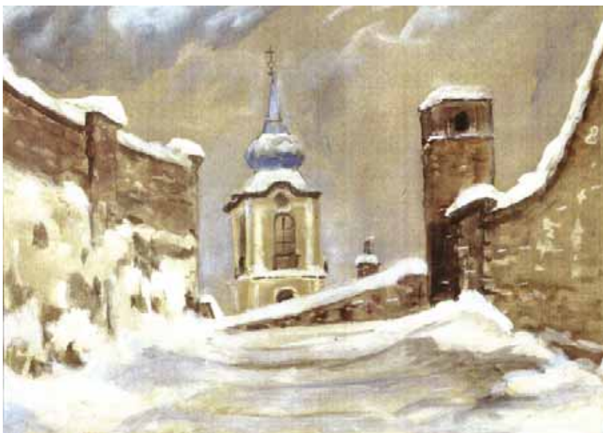
ZENÓBIA SIEKIERSKI (MAGYARORSZÁG) SZENTENDRE TÉLEN