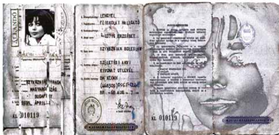
WANDA SZYKSZNIAN (MAGYARORSZÁG)