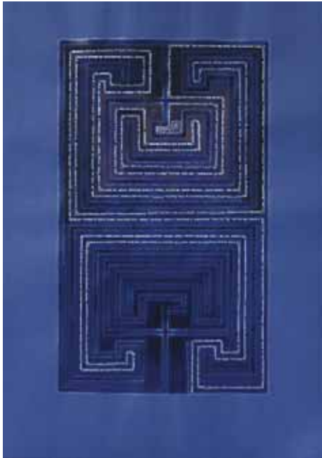
KRYSZYNA GRZEGOCKA (LENGYELORSZÁG) LABIRINTUS I.