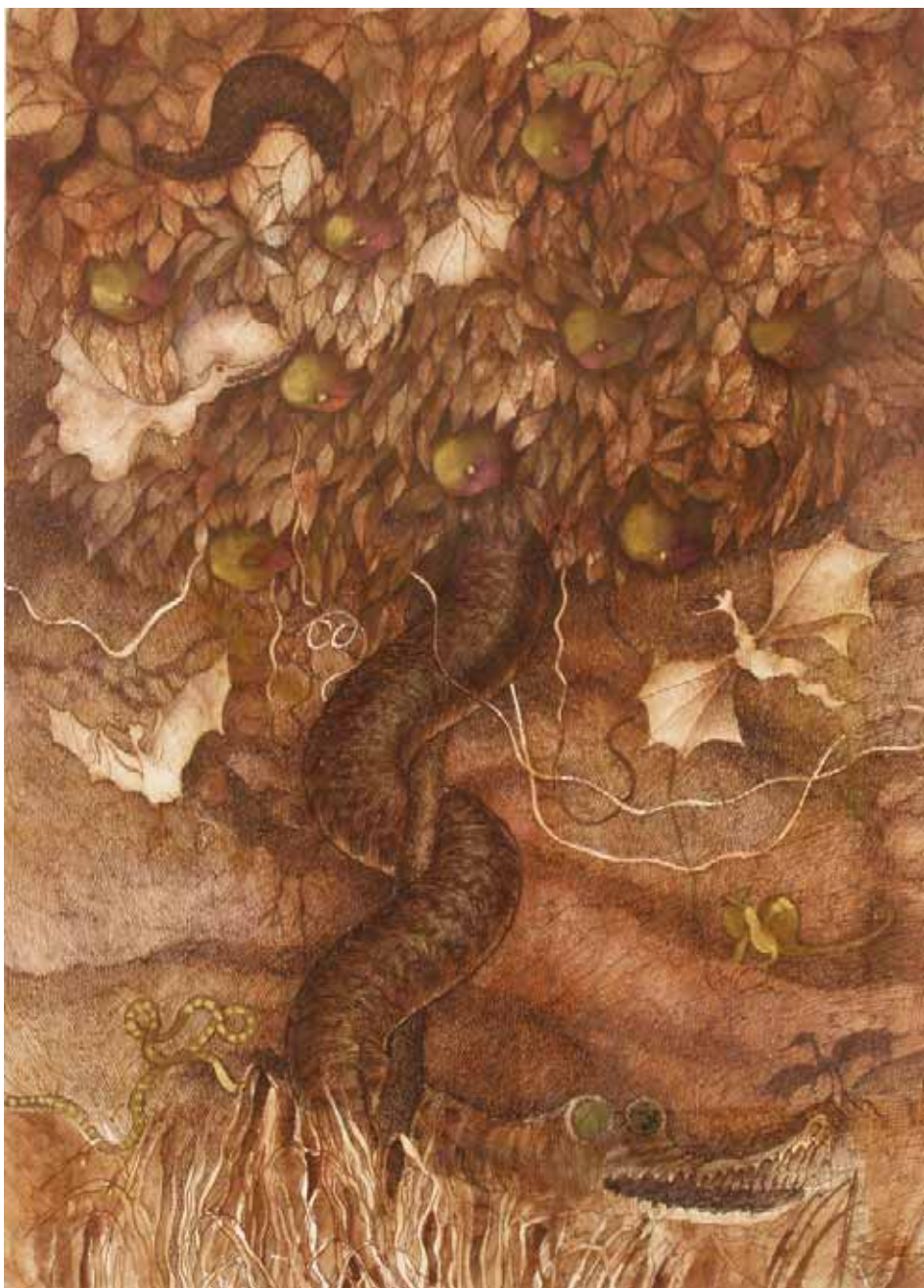
DARINA KRYGIEL (CSEHORSZÁG) ELVESZETT PARADICSOM