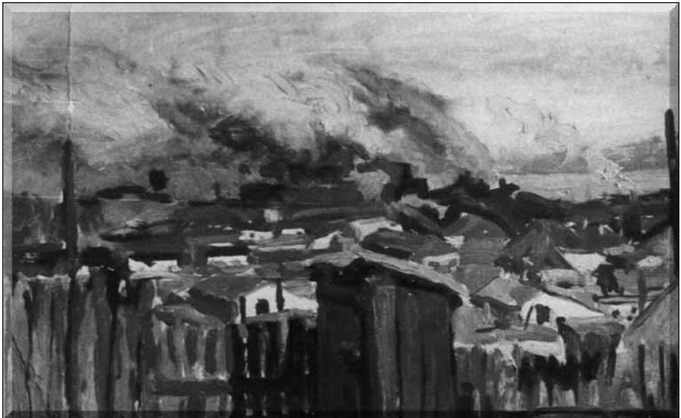
HILARY GILEWSKI (LENGYELORSZÁG)

Shuty Krakkó gigantikus ipari elővárosában, Nowa Hután nőtt fel (innen az írói álnév: Sławomir z Huty, vagyis Sławomir Hutáról), s ez alapvető létélménye írásainak. Shuty az öt körülvevő, könyörtelen valóságról ír, állandó témája a konzumpció, amit a jelen társadalom körtüneteként ábrázol. Előszeretettel nevezi magát „Lengyel Termék”-nek (Shuty™), vagy „Az Átgázolt Lengyel Valóság Fogyasztójá”-nak.