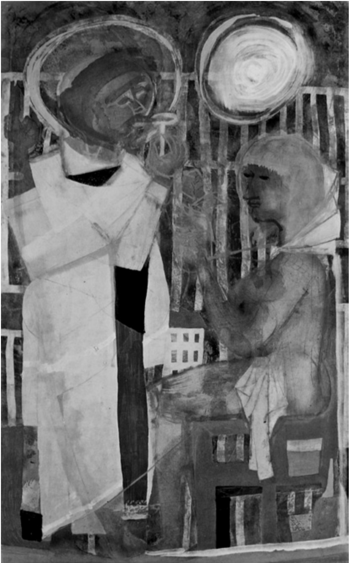
Szent Péter és egy nő I. 1967