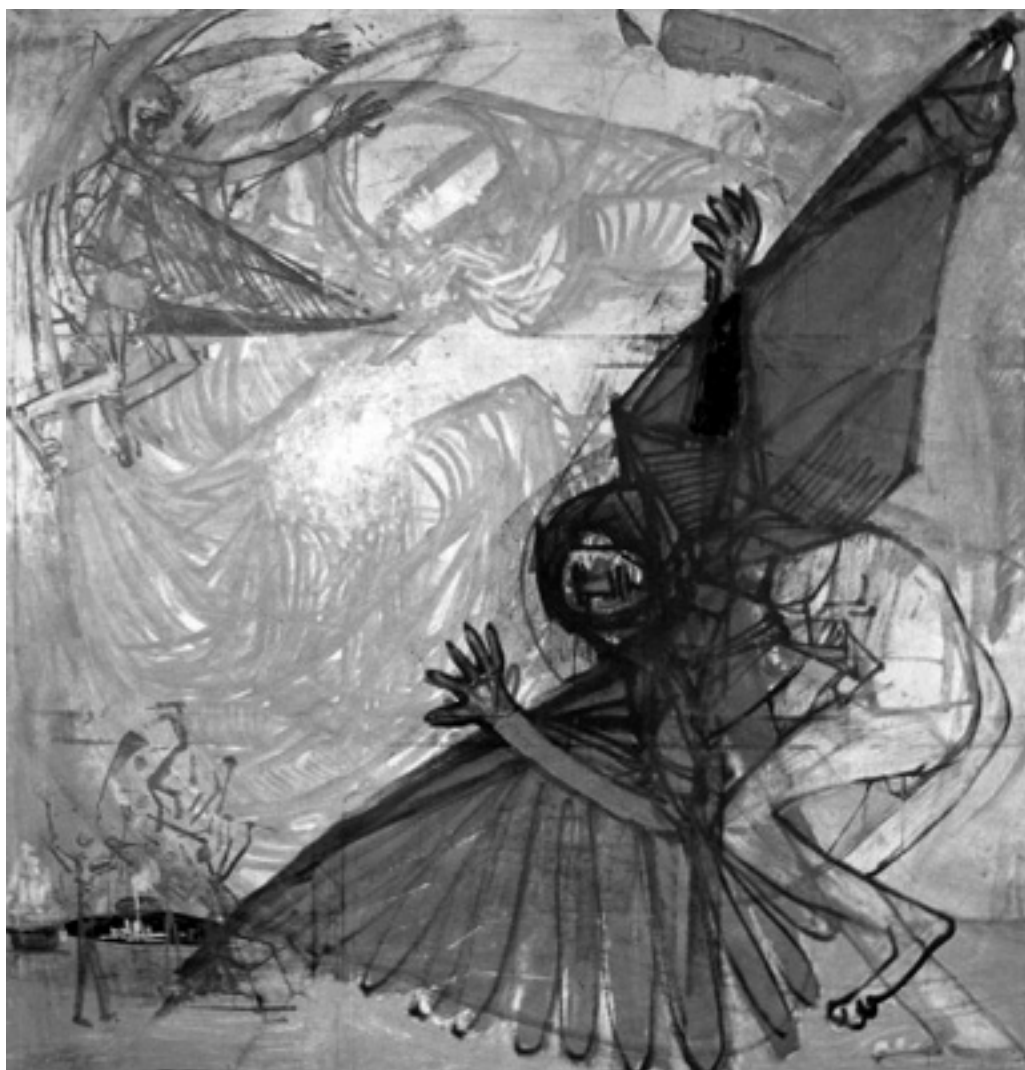
Bukás, (Szent Antal megkísértése) 1967

Az angyal-motívum másutt is visszatér: már a kezdet kezdetén ( Angyalpár , 1958-ból) aztán nagyvonalúan A repülés géniusza (1964) című képén. Itt bár csak mellékesen „említve”, de ott a repülni akarás angyali modellje. Az angyal motívum „használatában” az a csodálatos, hogy Kondornál nem a „jó” metaforáit képviselik: vagy földiek, csak épp szárnyakat viselnek, vagy „technikusok” (mint a repülés géniuszában), vagy kifejezetten negatív szereplők. Igen, „gonosz” angyalok is vannak. Ld. pl. a Szentek bevonulása a városba című nagy murálisát, ahol már a sötét angyalokat láthatjuk – igaz, pálcika-figurákként, de ezek a sötét alakok a „város” rendőreiként fogdossák össze azokat a lakókat, akik menekülnének a „szentek” bevonulása előtt – legalábbis ahogy én lefordítom e figurák rohángzását. Az angyal-mítosz ilyen kétértelmű felfogása (ábrázolása) szerintem egyedülálló a festészetben. Mondanám