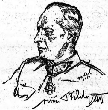
és hatalommal. A siker tehát nem maradhat el.

soha még Magyarországon nem képviselték a magyar sport és testnevelés ügyét ennyi határozottsággal, hozzáértéssel, korszerű felfogással, lelkesedéssel