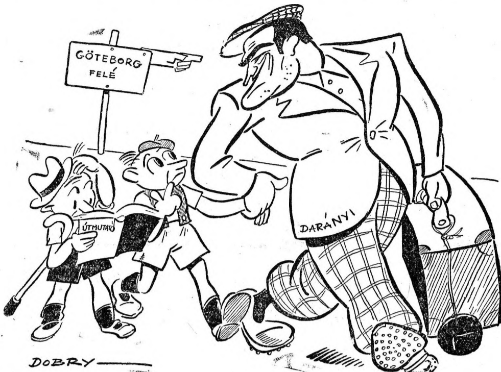
Darányi bácsi: Csak arra vigyázzatok vezető gyerekek, hogy ne engedjétek el a kezemet. Akkor minden rendben lesz...