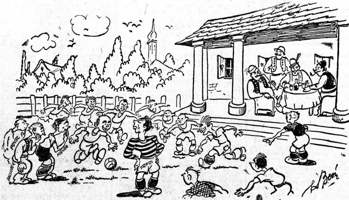
— Apa! A Fradi Feri nem akarja közeink engedni az új gyerekeket! — Nem az övé a labda! Csak jöjjenek azok az új gyerekek!