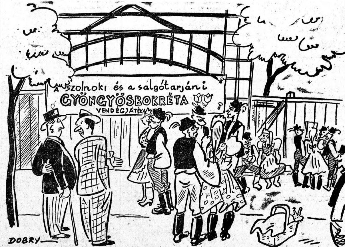
Hogyan? Festi bokréta nem játszák!