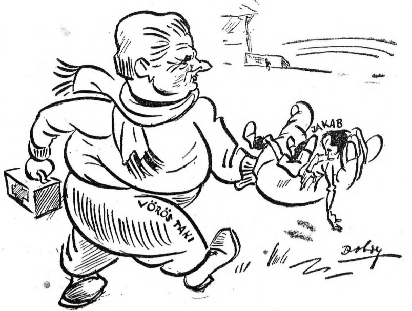
A sérült Jakabot kiviszik a pályáról