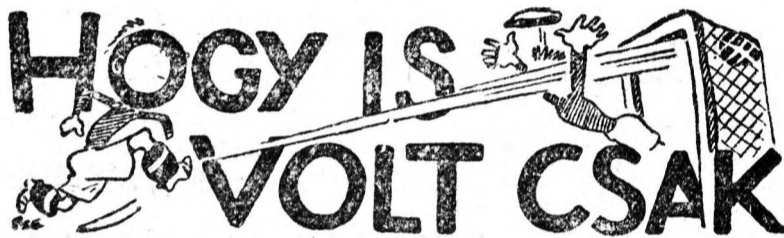
(A vasárnapi mérkőzésekről még az alábbi apróságok szedték össze munka-lásaink jegyzetfűzetéből.)