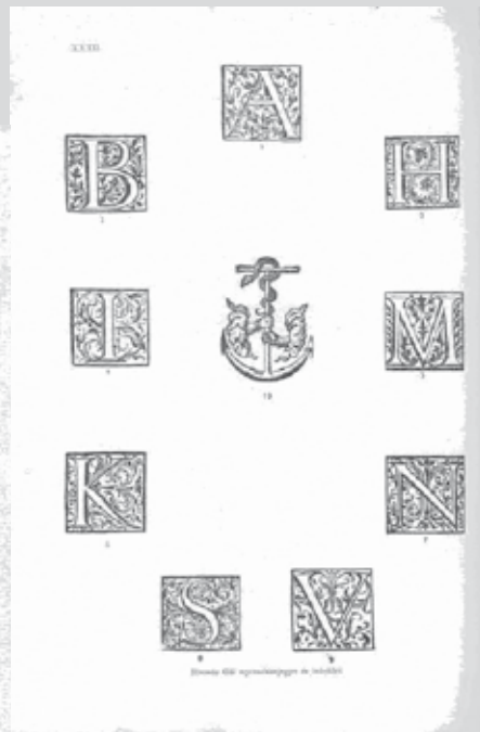
Huszár Gál nyomdászjegyei