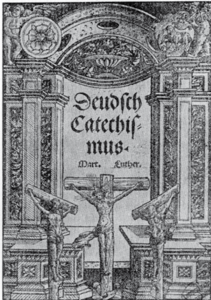
7. kép. Luther Nagy-kátéjának címlapja. Fent a bal sarokban látható a Luther-rózsza.

„A mi bűneinkért (Róm. 4, 25.) – ez azt jelenti, hogy bűneink öreá nehezdednek... Krisztus hordozta a bűnt büntelenül és ő szenvedte el azt a büntetést, amire nem ő szolgált rá. Ezek az Igék túl súlyosak: a szív sem fogja fel, csak akkor, ha a Szentlélek írja bele, úgyhogy bizonyosan tudom, nem vagyok többé bűnös. Mert az, aki nem tartozott volna meghalni, és