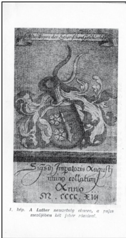
1. kép. A Luther nemzetség címere, a pajzs mezőjében két fehér rózsával.

Luther később jelvényét nem csupán egyszerű pecsétnek tekintette, hanem címerének is. Feleségének, Bóra Katalinnak a torgau városi templomban lévő síremlékén a Bóra család címere mellett a Luther-rózsza címerpajzs is látható. Ez a Luther gyermekek által