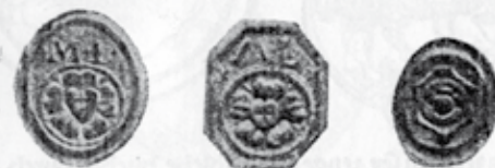
2. kép. Luther pecsétjei az 1516, 1517 és 1530 évekből.