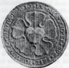
5. kép. Luther-rózsája egy 1523-ból való érmen. Felirata: In silencio et spe erit fortitudo vestra. Esa. 30. (Csöndességben és reményességben lesztek erősek. Ésaids 30.)

„Ne azon örüljétek, ami jelen van, amit megtapasztaltok és megismerhettek. Ugyanis kétféle öröm van. Lehet örülni a láthatóknak. Ez hiábavaló öröm, mert mulandó. A másik öröm a láthatatlanoknak örül, azoknak, amiket nem lehet ésszel megismerni, csak hitben.