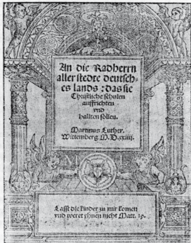
6. kép. Luther: An die Ratherrn... c. művének címlapja a Luther-rózsával.

19 Calwer III. 197. o. Luther 1529. máj. 16. pünkösd vasárnapján tartott prédikációjából.