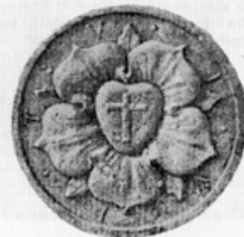
8. kép. A Luther házában lévő ú. n. »Katalin kapu« Luther-rózsája, kőben a VIVIT felirás.

A képzéken látható Luther-rózsája Luther házában a főkapujánál, az ú. n. Katalin kapunál kőbevésvé található. Ezt a kaput 1540-ben készítette Luthernek ajándékkul felesége. Jobb és bal felől a köböl ülőhelyeket képezték