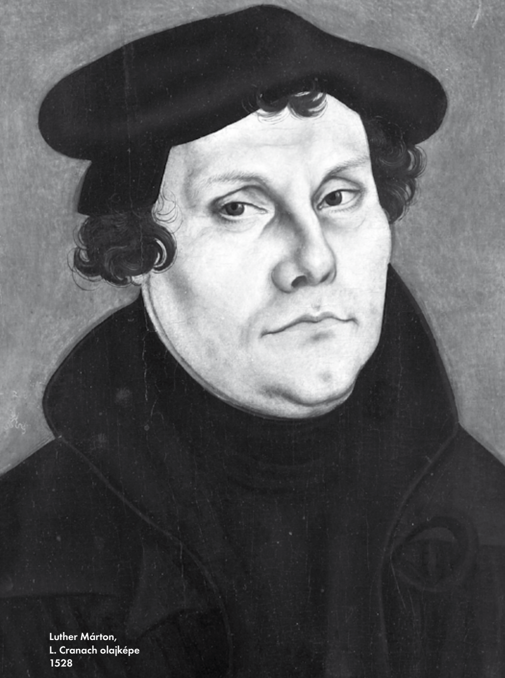
Luther Márton, L. Cranach olajképe 1528

tető zavarok keletkeztek. Hirt vevén ezek felől Luther, ki ezen időtől fogva kivált minden romboló újjátásnak ellensége volt, a fejedelem akaratára ellenére Wartburgot elhagyta, Vittenbergában termett (1522. márc. 7.), egy heti prédikálása által Karlstadtot a további újjátások abbanhagyására birta, a keresztségisméltést sürgetőket a városból kiűzette, s általában a zavarokat lecsendesítvén, a reformációt ismét a rendes kerékvágásba vezette.