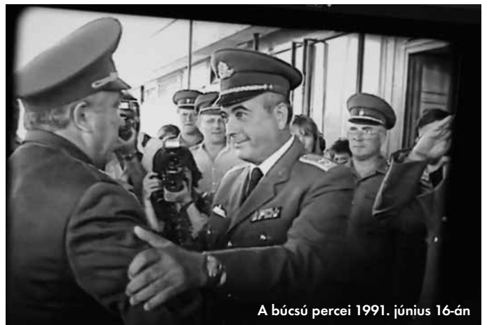
A búcsú percei 1991. június 16-án