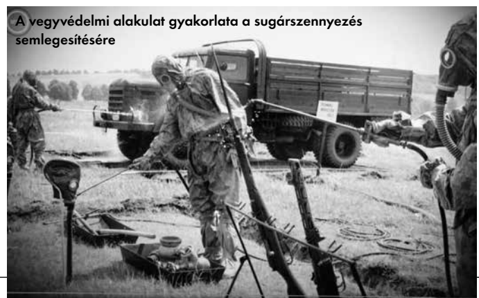
A vegyvédelmi alakulat gyakorlata a sugárszennyezés semlegesítésére