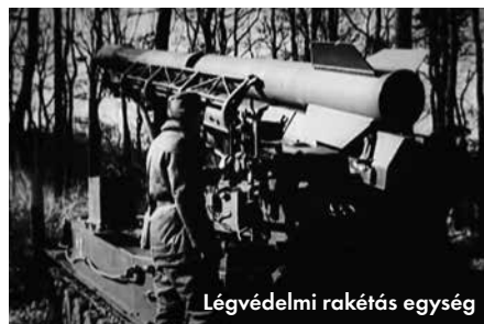
Légvédelmi rakétás egység