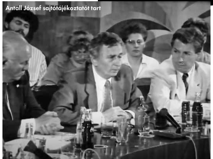
Antall József sajtótájékoztatót tart