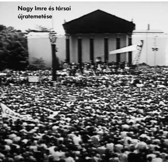
Nagy Imre és társai újratemetése