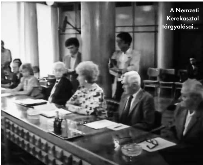
A Nemzeti Kerekasztal tárgyalásai...