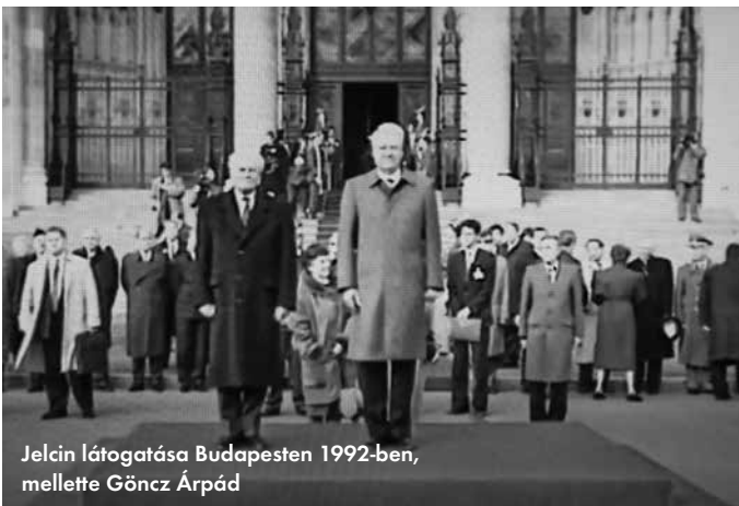
Jelcin látogatása Budapesten 1992-ben, mellette Göncz Árpád

A Kivonulás című dokumentumfilm alapján összeállította: Sággy Ildikó