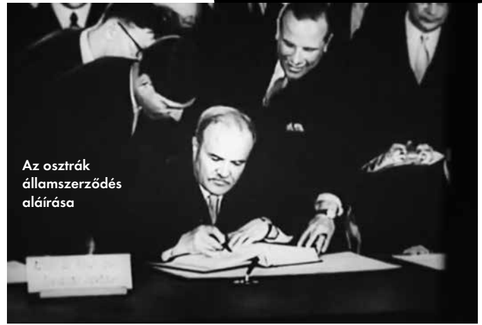
Az osztrák államszerződés aláírása