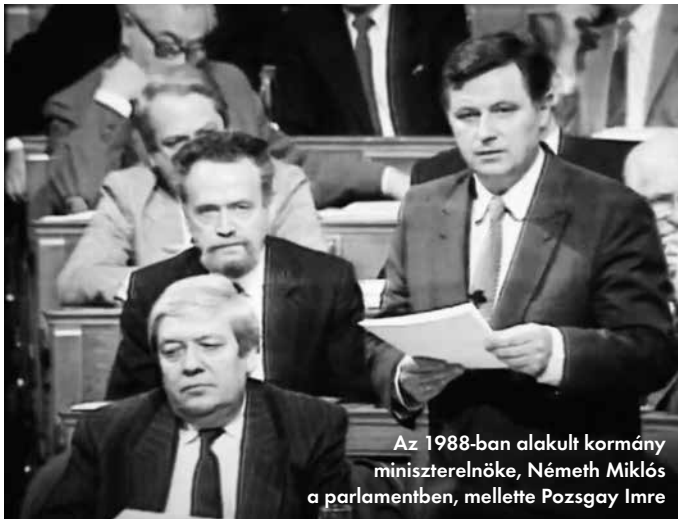
Az 1988-ban alakult kormány miniszterelnöke, Németh Miklós a parlamentben, mellette Pozsgay Imre