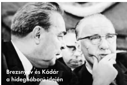
Brezsnyev és Kádár a hidegháború idején

Kónya Imre: – Mind a szovjet csapatok kivonása, mind a Varsói Szerződés megszüntetése közepette muszáj volt figyelemmel lenni a szovjet, illetőleg az orosz érzékenységre is. Tehát nem lehetett azt gondolni, hogy mi most, egyik pillanatról a másikra, áttesszük Nyugatra az országot, és ezt az oroszok nyugodtan nézik. Ugyanakkor meg kellett tenni bizonyos határozott lépéseket is, hogy azzal segítsük elő a