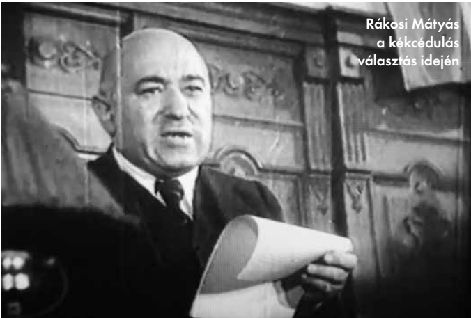
Rákosi Mátyás a kékcédulás választás idején