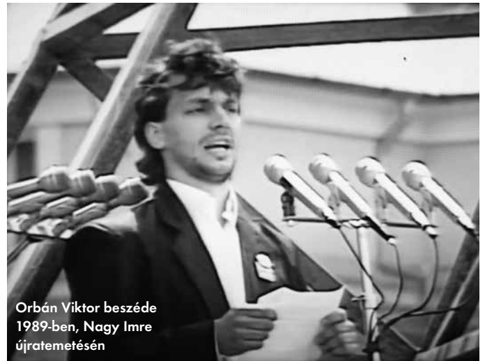
Orbán Viktor beszéde 1989-ben, Nagy Imre újratemetésén