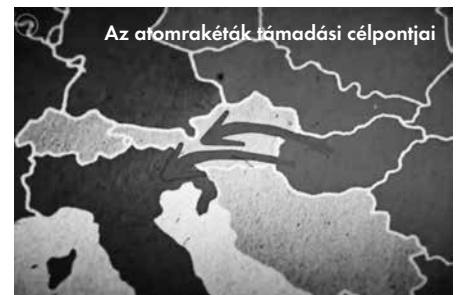
Az atomrakéták támadási célpontjai