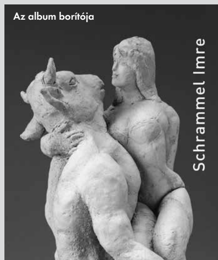
Az album borítója