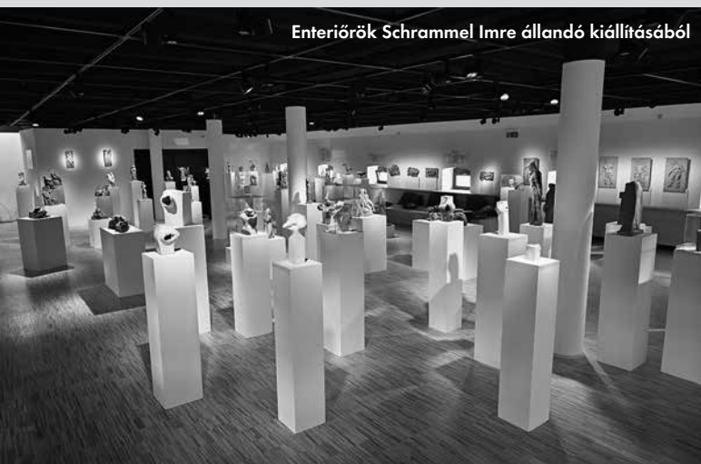
Enteriőrök Schrammel Imre állandó kiállításából