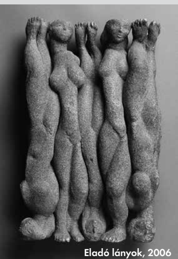
Eladó lányok, 2006