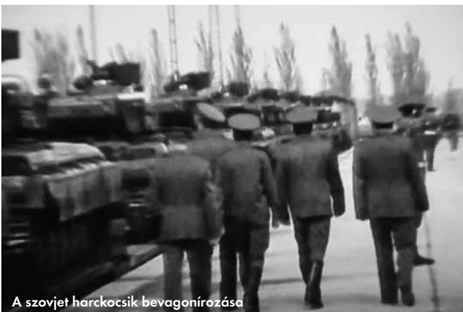
A szovjet harckocsik bevagórozása