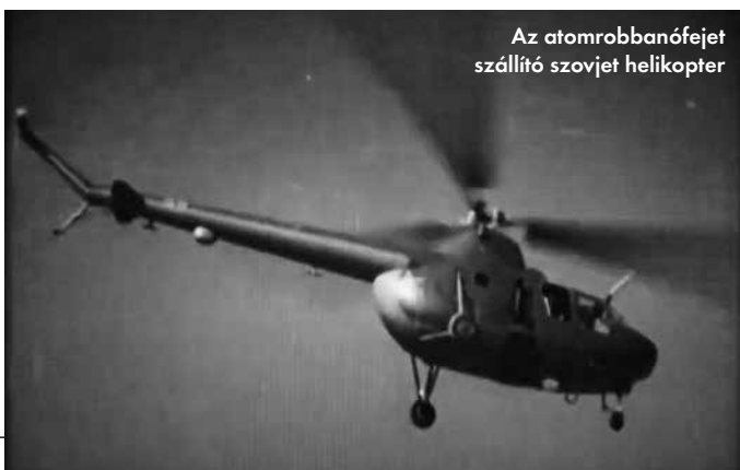
Az atomrobbanófejet szállító szovjet helikopter