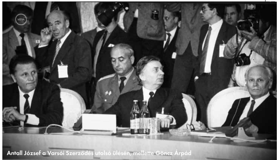
Antall József a Varsói Szerződés utolsó ülésén, mellette Göncz Árpád

atomfegyver létezett akkor Magyarországon, az egyik a repülőbomba, tehát olyan, mint amit Hirosimában alkalmaztak az amerikaiak 1945 nyarán – vagyis a nagy bombát nehézbombázó géppel, ha sikerül az ellenség fölé odamanőverezni, akkor ott ledobják és megsemmisíti az ellenséget –, a másik pedig a rakétaegység. És megtudtuk, hogy a szovjet rakétasilókban a Dunántúlon is, talán az Alföldön is ott vannak a robbanófejek... Úgy lett volna, hogyha kirobban a háború, akkor a Magyar Hadsereg hagyományos tüzérsége, gyalogsága bevetésre kerül az osztrák alakulatok ellen, és az úgynevezett találkozási pontokon a szovjetek átadják a rakétafejet, amit, ugye, aztán a magyar csapatok kilőnek az adott ellenségre. Hát ez nem történt meg... Maradt viszont két nagyon fontos szempont: az egyik a vegyvédelmi alakulatok tevékenysége, a másik pedig az, hogy amikor a részleges csapatkivonás megtörtént, akkor, az én információim szerint, az említett öt helyről legelőször a termonukleáris fegyvereket vonták ki a szovjet csapatok. Amikor a csapatok kivonultak, akkor a Magyarországon lévő atomsilókat – ahol a föltételezéseink, később pedig a tudásunk szerinti szovjet atomfegyverek voltak – sugárzás szempontjából meg kellett vizsgálni. A vegyvédelmi csapatok beöltöztek, és sugármérőkkel megmérték, hogy milyen