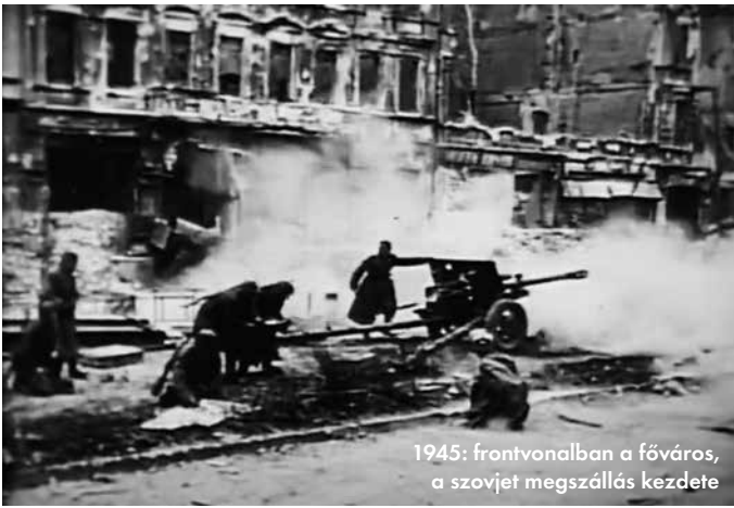
1945: frontvonalban a főváros, a szovjet megszállás kezdete