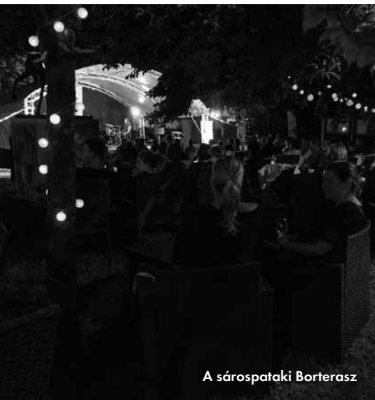
A sárospataki Borterasz