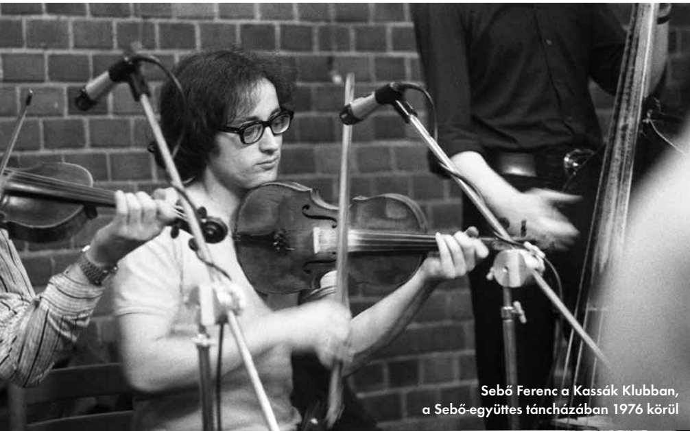
Sebő Ferenc a Kassák Klubban, a Sebő-együttes táncházában 1976 körül