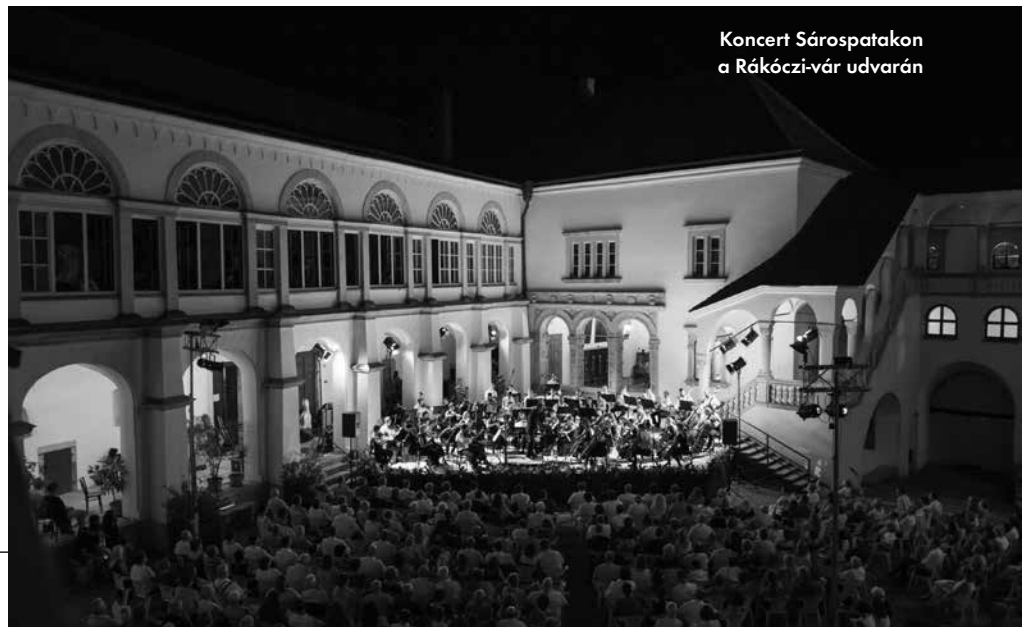
Koncert Sárospatakon a Rákóczi-vár udvarán

A fesztivál négy településen indult, de évről évre gyarapodott a helyszínek száma, s az olyan programokból is egyre több akadt, amelyek csak a Zempléni Művészeti Napok sajátjai voltak: a promenádkoncertek, majd később a kirándulókoncertek, amelyek során a résztvevőket busszal vitték a legkülönlegesebb helyszínekre, és ahol a koncertek után a vendéglátó települések lakói finom harapnivalókkal, borral kínálták a közönséget. Sétahajózni lehetett a Bodrogon, jazz-zene mellett, reneszánsz étkeket kóstolhattak az érdeklődők a Vörös-toronyban, a második esztendőtlől szintén szerepeltek a programban színházi produkciók. 1995-ben elkezdődött a „szomszédolás” is: Kassán, majd az évek során más szlovákiai