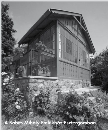
A Babits Mihály Emlékház Esztergomban