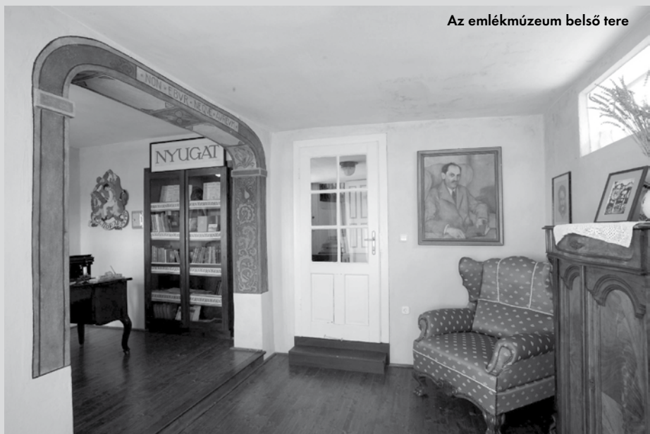
Az emlékmúzeum belső tere