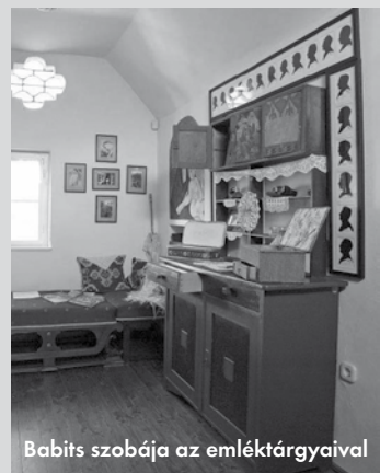
Babits szobája az emléktárgyaival