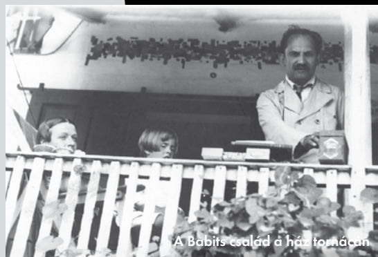
A Babits család a ház teraszán