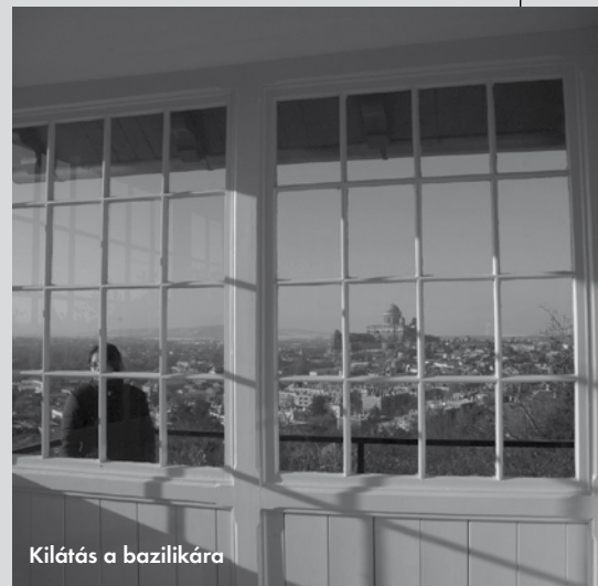
Kilátás a bazilikára