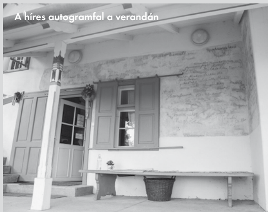
A híres autogramfal a verandán