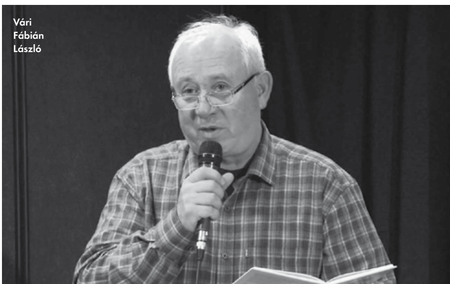
Vári Fábián László

Március 15-e alkalmából Kossuth-díjat kapott Vári Fábián László Babérkoszori és József Attila-díjas költő, műfordító, néprajzkutató, a Magyar Művészeti Akadémia rendes tagja Magyarország számára kivételesen értékes művészi pályafutása során megalkotott, a kárpátaljai magyarság nemzettudatát erősítő művei, szenvedélyes hangvételű, gazdag képi és formavilágú lírai alkotásai, kordokumentumként is szolgáló, egyszerre drámai és humoros, önéletrajzi ihletettségű regényei, valamint sokoldalú néprajzi gyűjtői, műfordítói és irodalomszervezői tevékenysége elismeréseként. A kitüntetés kihirdetése után Vári Fábián Lászlóval beszélgettünk életművének lényegéről és kárpátaljai forrásvidékéről.