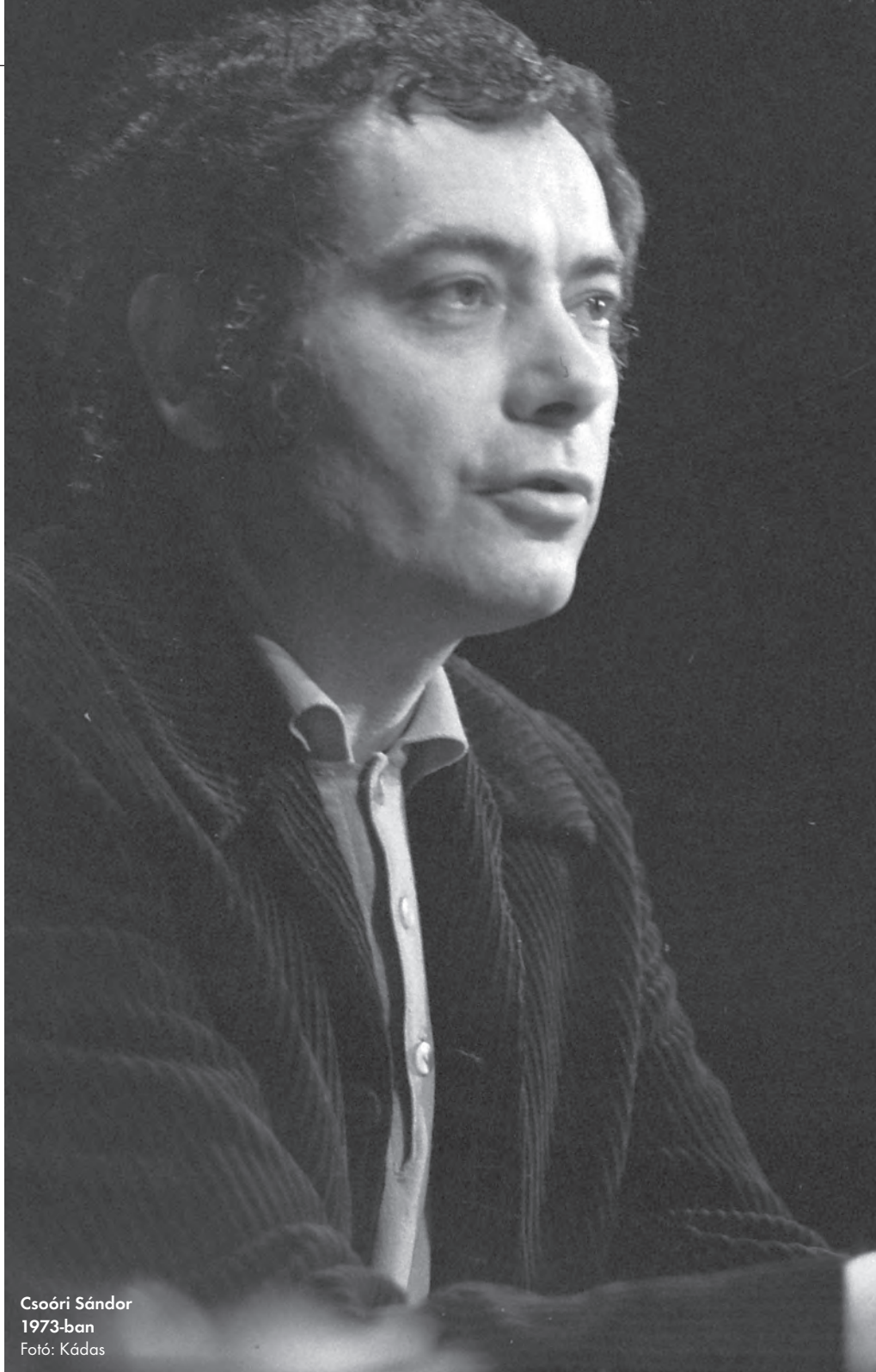
Csoóri Sándor 1973-ban

– Jobban megfelel a valóságnak, ha azt mondom, hogy mindig él bennem zene, öntudatlanul is, hirtelen konstátálom sokszor, hogy éppen hallok magamban egy bizonyos művet. Hogy a zene minden szegmense érdek-e, nem tudom, talán azok a darabok elsősorban, hangszertől, műfajtól függetlenül, amelyek megragadnak, bevonnak, adnak nekem valamit. Van ilyen bőven most is, ez egyáltalán nem csökken az évekkel. ♡