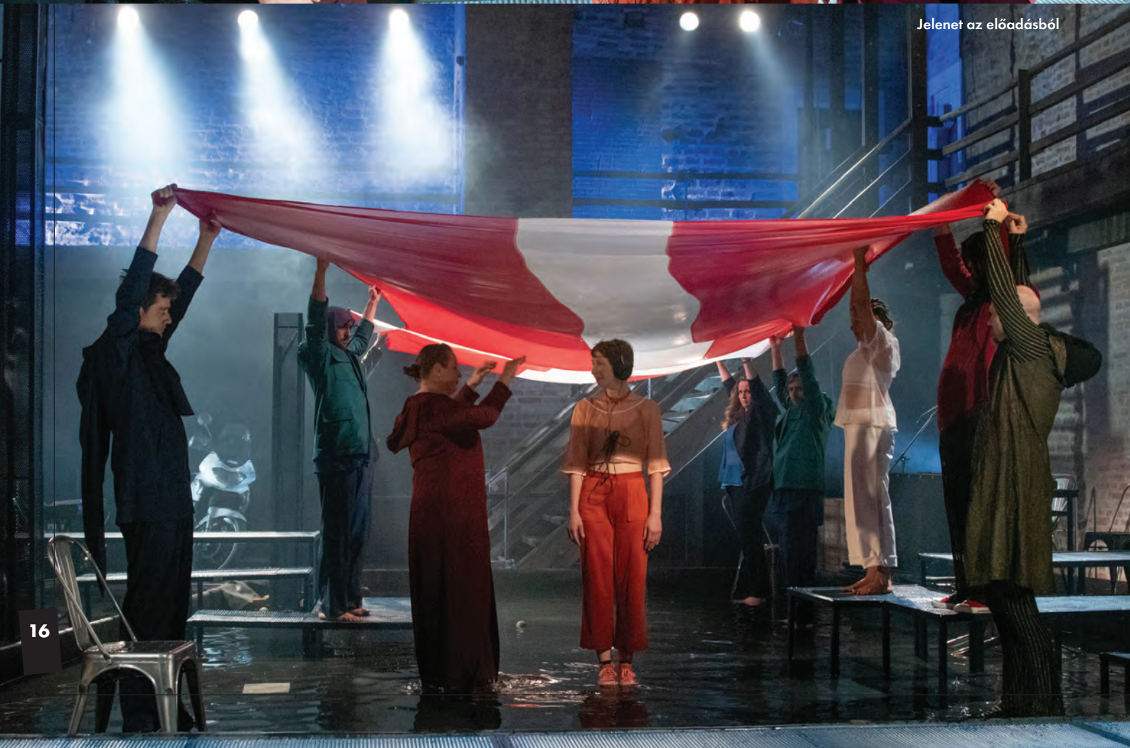
Jelenet az előadásból