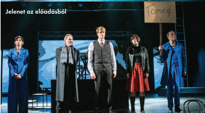
Jelenet az előadásból