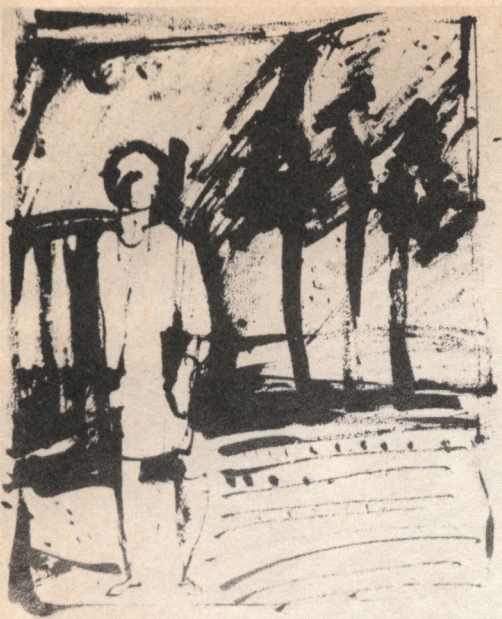
LIPTÁK PÁL műveiből (Cikkünket lásd a 487. oldalon)