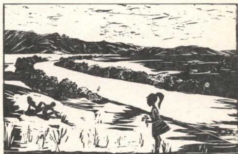
OLEJNYIK ÁGNES grafikáiból (Cikkünket lásd a 622. oldalon)