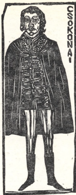
Perei Zoltán portré-fa- metszeteiből és egyéb grafikáiból. (Cikkünket lásd a 303. oldalon)