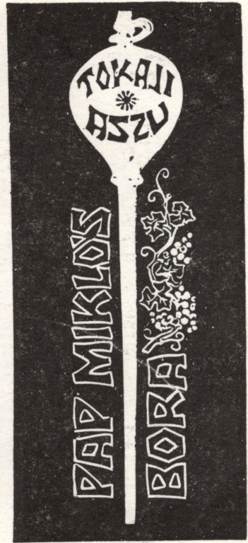
Szilágyi Imre munkáiból (Cikkünket lásd a 620. oldalon)