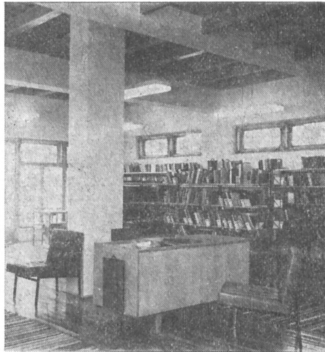
Baloldalt: a felnőttek könyvtárában, háttérben a zenél részleg forgószékeivel és kezelőpultjával. Jobboldalt a felnőtt részleg a közös kölcsönzőpulttal

kapcsolatának kialakítási szándéka, Medgyesbodzáson viszont már e törekvés kiteljesedéséről és tudatos funkcionális szerepéről szólhatunk: A kavicsal felszört, hat pergolás padcsoporttal tagolt ligetes parkban bármely városunk lakói szívesen elüldögnének. Vonzza ez a falusiakat is: a Medgyesegyháza—Csanádapáca út mentén, a tanács-háza, az óvoda és a templom mozgáskörzetének központjában, tehát a faluközpontban levő terület olyan, mint egy mediterrán sziesztatér, a korzó végpontja. Az oda kiülők, ott tanyázók, beszélgető emberek olyan helyre kerülnek, ahol a pergolás padok a kiskertek lugasában levő pihenőhelyekre, a korábban már említett tornác padjai pedig a lakóházak melletti vagy előtti kispadokra emlékeztetik őket, miközben a könyvtár világos ablakai szinte vonzzák a beszélgetőket a továbbmozdulásra, a könyvtárba betérésre, a könyvek vagy a 22 újság, folyóirat lapozgatására, a zenehallgatásra, esetleg a tágas, szép térben rendezett író-olvasó találkozóra. Szemlélődés közben egy darabig még háborognak a könyvtár zöld környezetébe illően „beültetett” fehér kőszobor vas-kos formáin, lassan azonban megszokják, netán meg is szeretik Seregi László „Esőváró” című szobrának (a Kulturális Minisztérium ajándéka) rusztikus tömbjét, talán egy kicsit jelképét is a kemény természettel kapcsolatban álló, szeszélyeivel dacoló sok évszázados paraszti sorsnak.