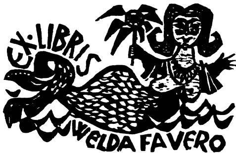
Diskay Lenke ex libris

A nyitás után bizonyosan megrohanják majd a kíváncsiak az új könyvtárt, ezért ahhoz, hogy az érdeklődők igazi olvasókká váljanak, nem ártott volna, ha az intézmény már a nyitáskor „teljes fegyverzetben” fogadja látogatóit. Emlékeztetni kell arra is, hogy az országban három, ún. „Olvasó népért”-mozgalmi bázis-könyvtár van: Aggteleken, Mezőberényben és éppen itt, Tök községben. Mit kíván ez a szerep, amit a község a központi segítség ellenében vállalt, de amibe még bele kell nőnie? Propagálni a Hazafias Népfront sajtótermékeit és kiadványait — remélhetőleg hamarosan megkapják ezeket a HNF ajándékaként —, népszerűsíteni az Olvasó népért mozgalom céljait, vállalkozásait, színvonalas irodalmi mozdulásokat szervezni, figyelni az olvasói magatartásokat, résztvevőket felkutatni és javasolni az olvasótáborokba, közvélemény-alakító olvasókat nevelni —, hogy csak néhány lehetőséget soroljunk fel kapásból a sok közül —, általában pedig: az olvasómozgalmi formák és akciók kísérleti műhelyévé változtatni a könyvtárt. Meg tudja tenni mindezt a töki könyvtár? A lehetőségei mindenestre megvannak rá. De még sok belső erőfeszítésre és külső ösztönzésre is szüksége van, s remélhetőleg a járási könyvtár és a megye figyelő szemén kívül állandó segítségük, gondoskodásuk is hozzájárul majd ahhoz, hogy ez a Pest megyei kis-község ne csak dolgos szövetkezeti gazdairól, hanem a könyvtár jóvoltából olvasó-művelődő embereiről is híressé váljék. (G. Gy.)