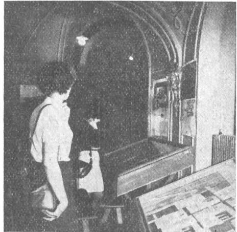
Képek a Fővárosi Szabó Ervin Könyvtár előcsarnokában rendezett csehszlovák könyvtárügyi kiállításról

tájékoztató központ létesítése Prágában az Állami Könyvtárban és Martinban a Matica Slovenskánál.