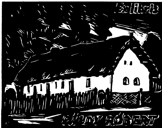
Andruskó Károly ex librise