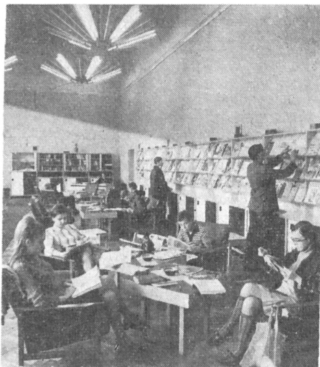
A pécsi hírlapolvasó