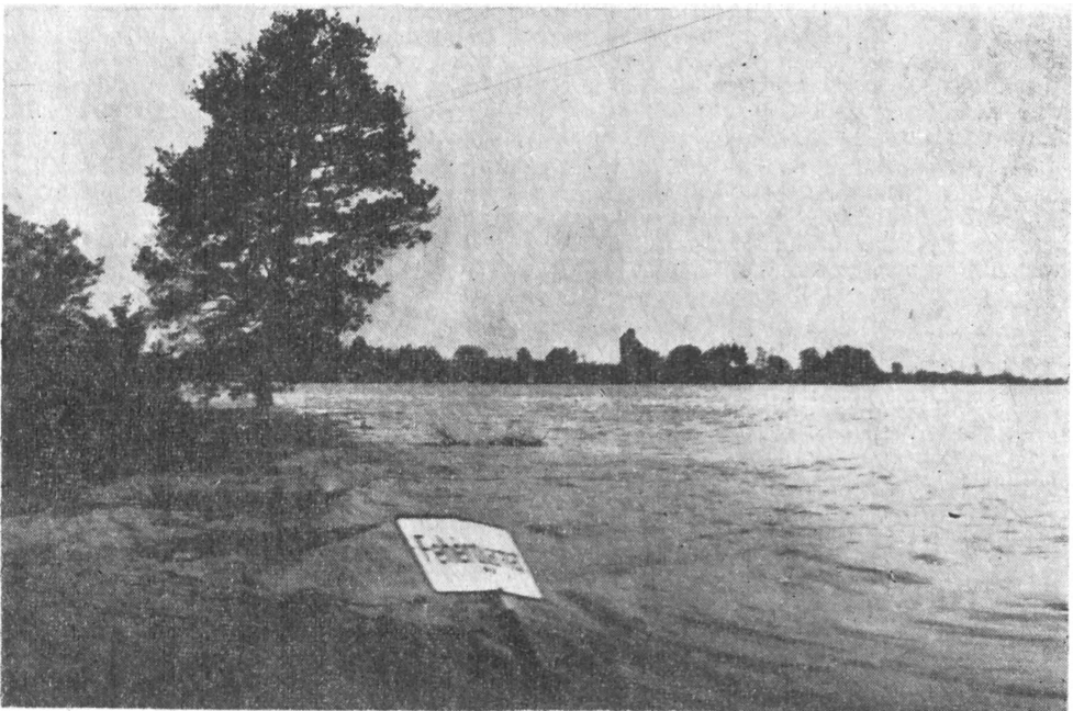
Fehérgyarmat — 1970 május

Ma még nem ismeretesek pontosan azok a károk, amelyeket az örvénylő szamosi árvíz a Szabolcs megyei közművelődési könyvtárakban okozott. Az eddigi adatok szerint a fehérgyarmati járásban 29 községi könyvtár károsodott, közülük a penyigei rombadőlt. Több könyvtár berendezése elázott. A könyvek közül elsősorban az olvasóknál levő művek pusztultak el az összeroskadó házak alatt. A tönkrement könyvek száma mintegy 25—30 ezerre tehető. Különösen nagy volt a pusztulás a Kisari Községi és a Fehérgyarmati Járási Könyvtár állományában. A helyzetet súlyosbítja, hogy a