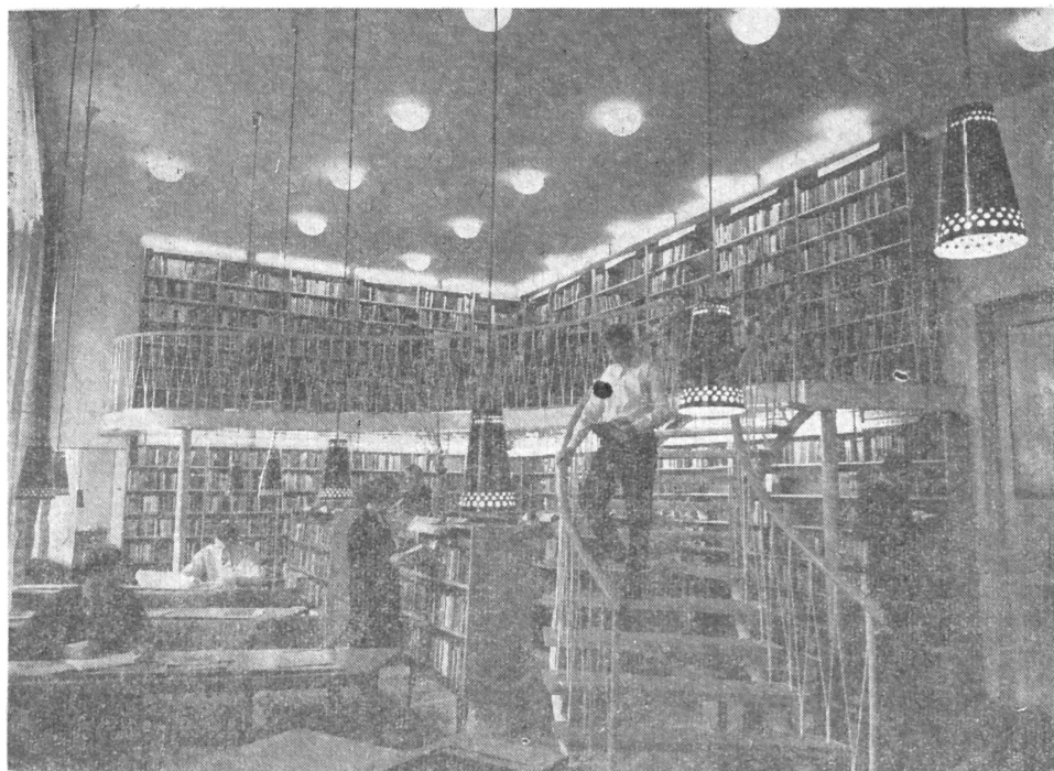
A városi funkciókat is ellátó ózdi szakszervezeti művelődési ház könyvtára

Felsőfokú közművelődési könyvtárakká minősülnek — mint városi központi könyvtárak — a mai megyei könyvtárak, továbbá indokolt esetben a 150 000 lakost meghaladó népességű tájegységek felsőfokú ellátást nyújtó városi központi könyvtárai (Baja, Pápa, Sopron, Nagykanizsa stb.). A felsőfokú könyvtár tartalmi teljességgel gyűjti a nemzeti könyvtermést, válogatással beszerez idegennyelvű könyvanyagot is, a magyar és világnyelveken megjelenő kézikönyvek, segédkönyvek gazdag készletét nyújtja, teljességgel gyűjti a hazai hírlap és folyóirat termést és a világnyelveken megjelenő periodikumok bő választékát (összesen kb. 500 címet), a helyi szükséglet-