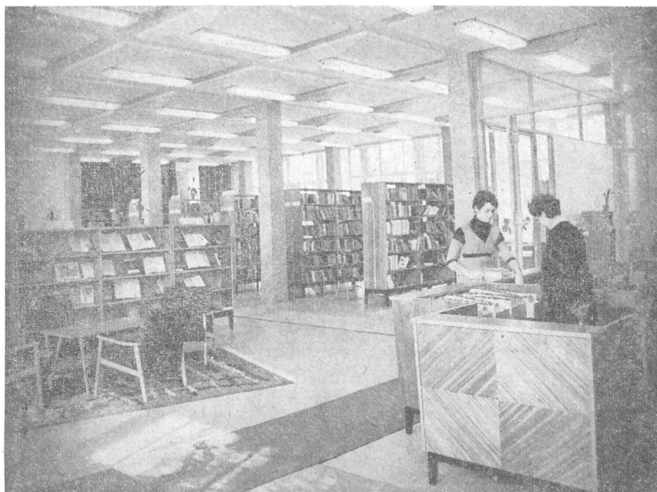
Kölcsönzőtér a Zalaegerszegi Megyei Könyvtárban

vitás, hogy az olvasónevelés céljából sok helyen továbbra is szükség van a munkahelyekhez közel vitt, mozgékony könyvtárakra. Ezért a koncentráció szükségességének hangoztatása és érvényesítése mellett gondoskodni kell rugalmasabb szervezési eljárások alkalmazására is. Ilyen például a munkamegosztás kifejlesztése a könyvtárak között, amely tekintettel lehet a fenntartói érdekekre, de főlegük helyezi az egész város érdekeit. A koncentráció és a munkamegosztás tervszerűen és rugalmasan alkalmazott szervezési elve — mindenütt alkalmazkodva az adott helyi körülményekhez — előre viheti a városok könyvtári ellátását, ha közben megfelelően alkalmazzuk a fokozatosság követelményeit is.