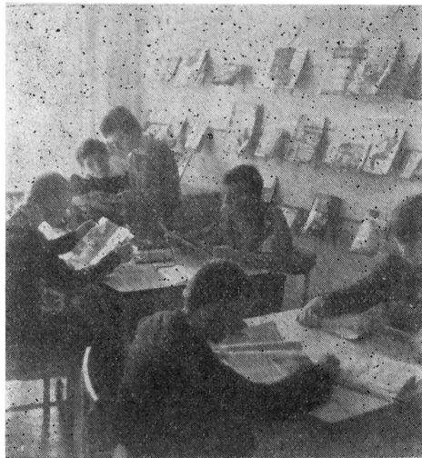
A Dienes László középiskola könyvtára

AZ ESEMÉNYNAPTÁR 1967/4. számát ünnepi számnak is nevezhetnénk, mert legfőbb útmutatásai, továbbá bibliográfiai és kiállítási segédanyagai nagyobbrészt a jubileumi év eseményeihez kapcsolódnak. Miként a „Könyvtáraink és az októberi ünnepek” című bevezető is utal rá, úgy rendezték a 4. szám anyagát, hogy az emberiség történetének e nagy fordulatóról tartalmazsan, a meggyőző dokumentumok feltárásával, a tények helyes értékelésével, színesen, érdekesen emlékezhessenek meg.