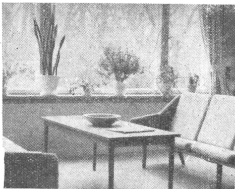
Kisvárosi könyvtár enteriőrje (Steve)

A könyvtárak telepítésénél figyelembe veszik az emberek szokásos napi jöve-menését, ugyanakkor azonban az a véleményük, hogy néhány nagyobb könyvtár jobb szolgálatot tehet, mint több kisebb, kevesebb gonddal telepített fiókkönyv-