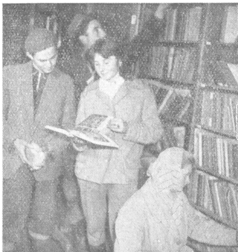
Az ecsédi könyvtárban

A Hazafias Népfronttal és más társadalmi szervezetekkel való együttműködésünk azonban nem korlátozódott csak