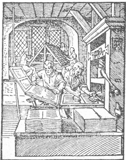
A festékező és a nyomtató, aki a kiszedett ivodalt kiemeli a punkturás keretből. Háttérben a szedők. (Uo.)

A lenyomás után kivették a legfelső ívet az immár olvasható lappal. A punk-