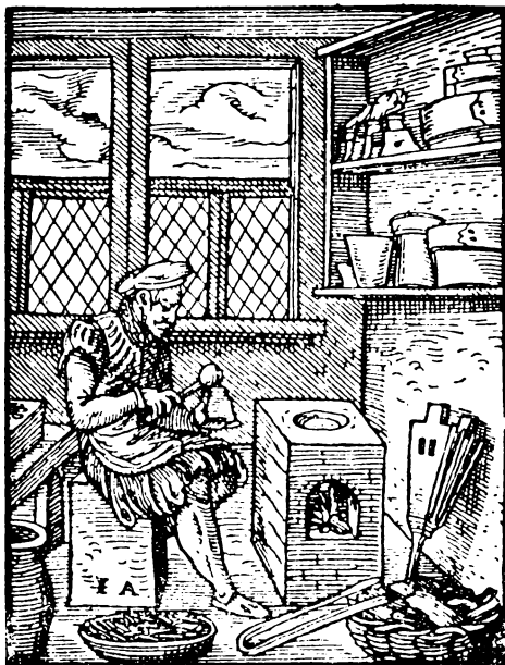
A betűöntő. (Uo.)

Magá a könyvtermelés azzal kezdődött, hogy a szedők megkapták szedésrészeiket. Mindegyik szedésrésztelen