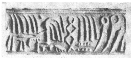
Pecsetnyomó henger lenyomata az egyiptomi Obiroadalom idejéből

Ez az ember agyában végbemenő jelkép alkotó folyamat tehát megfordítható