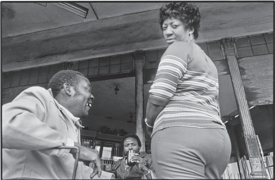
© Benkő Imre: Havanna. Kuba, 1985

Senki se léphet többé úgy, ugyanabba a nyárba, télbe, folyóba, ha minden változik, és vele testünk sejtjei, én-tudatunk és múltó szellemi lényünk... Elpattant buborék – oly véges az emberi élet, egyszeri, kis töredék-létünkről bölcs bizonyosság: minden perc (m)érték, soha nem tér vissza a régi. Persze kevés „megtörténnünk”, mintegy „balesetként”, tetteiért van megmértve az ember a földön. Nem kormányozhatjuk a létünk szembe magunkkal, versenyt futva az úton visszafelé, anyaméhig, honnan elindultunk hódítani ezt a világot, s minthogy örökké hajt, pulzál bennünk ez a rezgés, merre keressük utunk, vagy az út meglelhet-e minket?