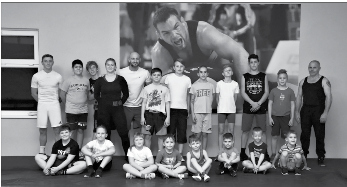
Csoportkép a legfiatalabbakkal egy edzés végén. A nagyobbak sokszor segítőként és egyfajta példaként vesznek részt a fiatalok kinevelésében.