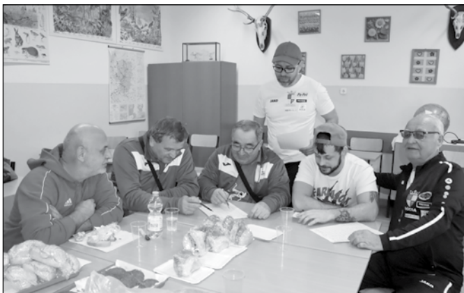
A csapatok vezetői megbeszélést tartanak