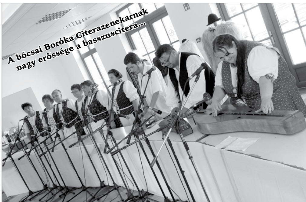
A bócsai Boróka Citerazenekarnak nagy erőssége a basszuscitera...

népzenei tábor, az érdeklődés így is nagy volt. A fellépők az öt éves születésnapját ünneplő bócsai Boróka Citerazenekar meghívására Ágasegyháza, Tizsakécske, Tázlár és Zsana dalosai és citerásai voltak. Elmondható, hogy mindegyikük készült valami különlegességgel erre az alkalomra. Kárász István főszerző például egy nem igazán ismert kiskunhalasi pásztordalt tett be műsorukba, melyet a XX. század közepén gyűjtött fel Szomjas-Schiffert György néprajzos.