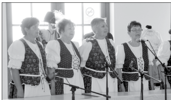
...a másik erőssége pedig a hölgyek!

A tavalyi nagy siker után idén is megrendezésre került a citerazenekarok és népdalkörök találkozója Bócsán. Noha ezúttal nem előzte meg az eseményt