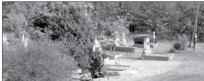
Kisbócsa, temetőtakarítás után, 2015

Tisztelt Temetőlátogatók, Sírfenntartók! Ezúton kérjük a hozzátartozókat, hogy a sírokat és azok környékét sziveskedjenek rendbe tenni Mindenszentek napjára. Ne engedjük, hogy elgázosodjanak és szemetesek legyenek Bócsa temetői!