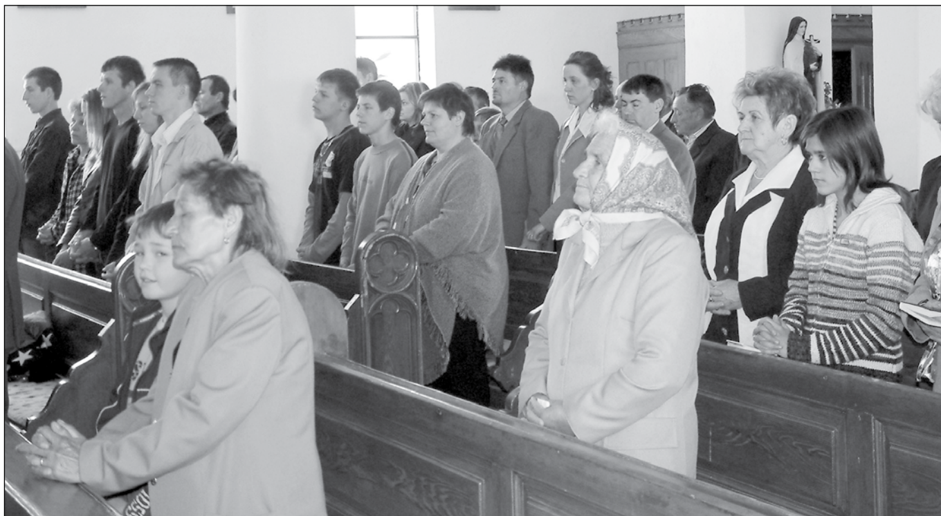
Archív felvétel, készült 2007 húsvétján a fischerbócsai templomban