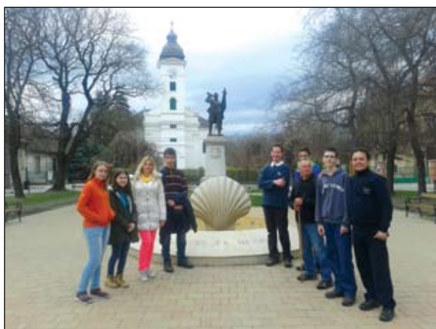
Dunavecse a Magyar zarándoklat emlékművénél

A bócsai katolikus egyházközség tagjai rendszeresen szerveznek kirándulásokat a természetbe. Ennek egyik különleges formája a zarándoklat. Magyarországon több alföldi és hegyvidéki zarándokútvonal ismert, melyek kialakítása az elmélkedést,