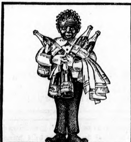
A. MALÁTA-PEZSGÓ-SÖR HOGYHA MINDIG ISSZA EGÉSZESEGTÉ PÉNZE EGYRÉSÉT JUTALOMKÉNT KAPJA VISSZA. GYÁRTJA A FŐVÁROSI SÖRFŐZŐ R.T. KÖRNYÁN.

Meg szabad-e tekinteni az adókvivétési iratokat? Az adókvivetés eredményét közli fizetési meghagyásnak az érvényes szabályok szerint indokolást kell tartalmaznia. Egyszerűt ugyanis a tömeges fizetési meghagyások legtöbbször csak nagy vonalakban adnak az adózottas menetéről felvilágosítást, másrészt igen gyakran nem örzik meg (vagy időközben elvesztik) az adózók a saját adóbevallásuknak másolatát s így nem tudják azt a fizetési meghagyással pontról-pontra összehasonlítani. Az érvényes közadókezelési szabályzat megengedi, hogy az adózó a saját adójának kvivétési iratait személyesen vagy igazolt meghatalmazottja útján a m. kir. adóhivatalnál (kerületi adófelügyelőnél) a hivatalos órák alatt megtekintthesse és abból kivonatot készthesse. Hasonlóképpen jogában áll a kvivétési lajstromnak azt a tételét, amely alatt a rá kvivétett adó nyert bevezetést, megtekinteni s magának lemásolni.