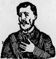
Megfojt ez az átkozott köhögés.