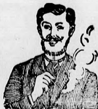
Egger-mellpasztilla csak-hamar meggyógyit!