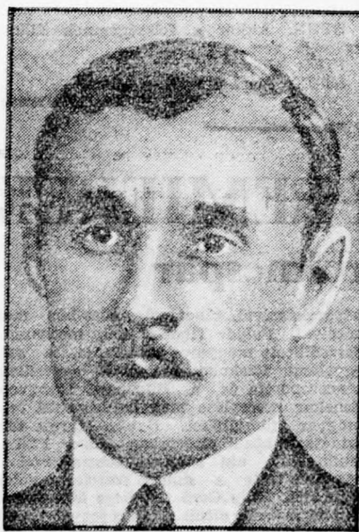
Skoblin orosz tábornok, akinek Miller tábornokkal együtt Párisban nyoma vészett