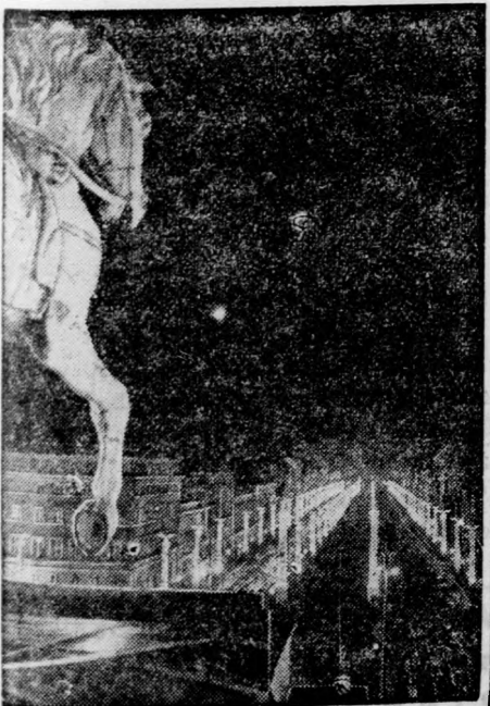
A berlini Unter den Linden útszélén a Mussolini kíséretének