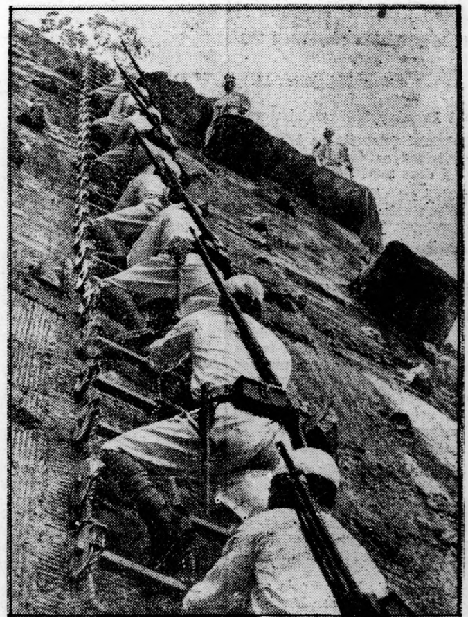
„A NAP FIAI”

Peiping kínai város művészikivitelű kapuja, amely előtt csaptak össze először a kínai és japán csapatok