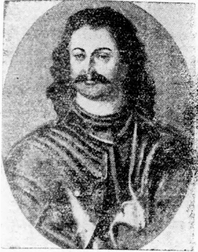
II. Rákóczi Ferenc

HÉTFŐ, 1937. ÉVI MÁJUS 3 XIII. ÉVFOLYAM + 18. SZÁM