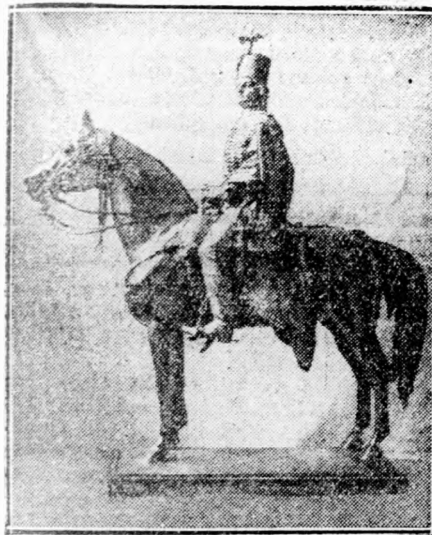
Gróf Hadik András lovasszobra

Az osztrák különvonat reggel 8 órakor érkezik meg Hegyeshalomra, ahol ünnepiesen fogadják.