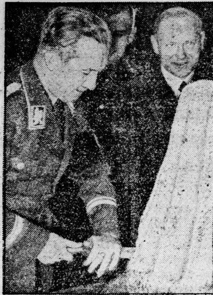
Berlin főpolgármestere vendégül látott száz árva gyermeket. Uzsonna előtt felvágja az óriási kalácsot.