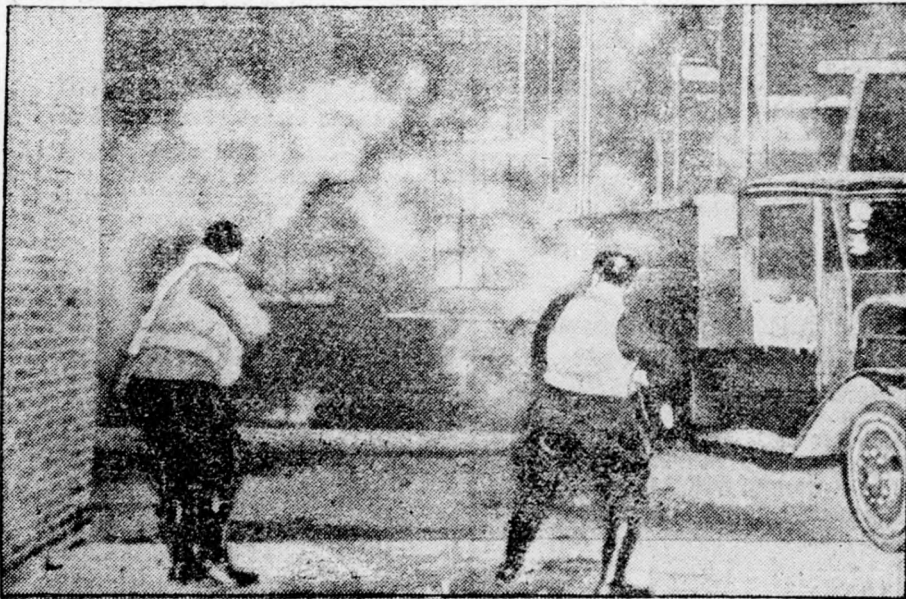
Könnygázzal támadt a csikágói rendőrség egyik nagy gyár sztrájkoló munkásaira.