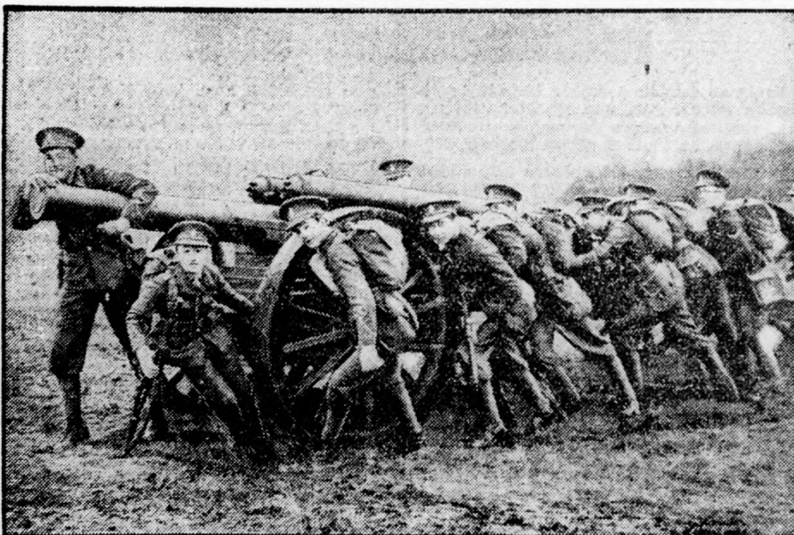
Az angol iskolák növendékeit katonai kiképzésben részesítik.