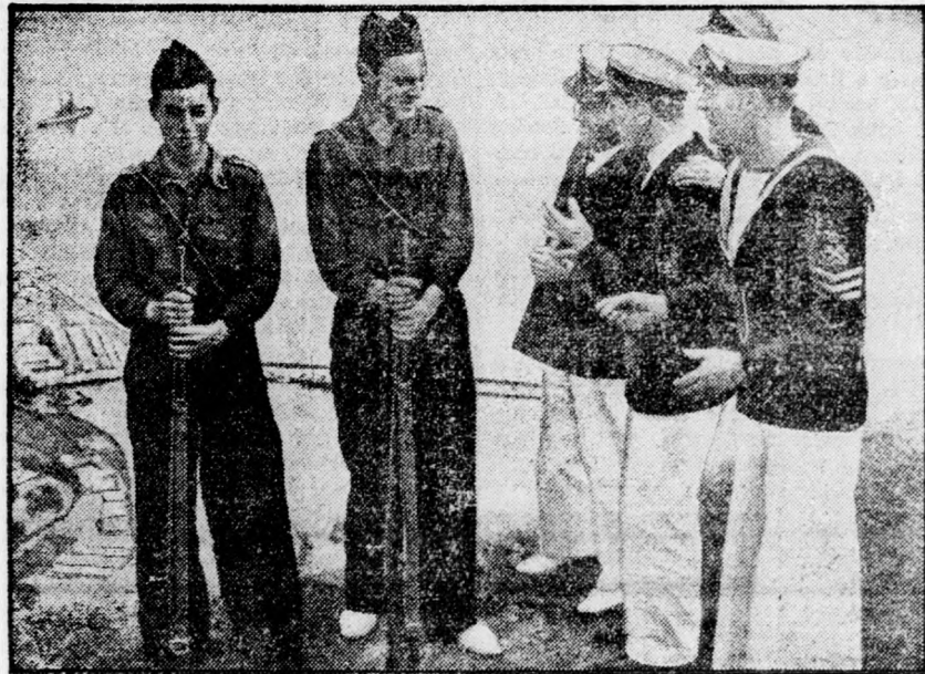
Angol tengerészek barátkoznak a spanyol nemzeti hadsereg katonáival, de csak jelbeszéddel tudják magukat megértetni.