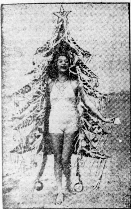
Amerikai karácsony: Miss California 1936 magára ülti a karácsonyfát