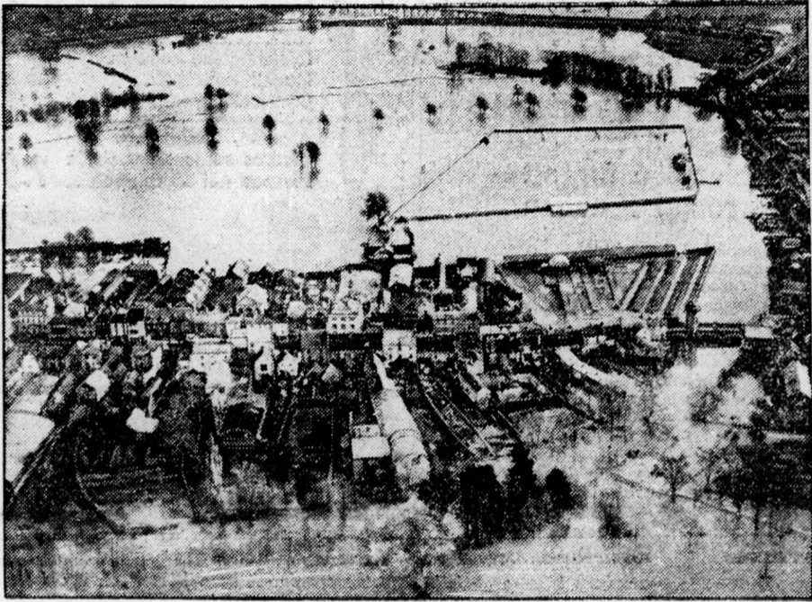
Moumouth északamerikai város a nagy esőzések okozta áradások középpontjába került. A víz teljesen elzárta a külvilágot!