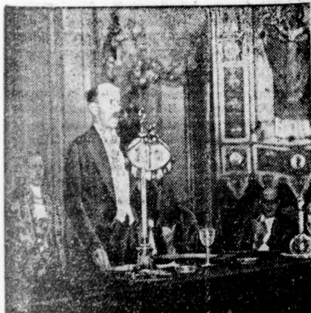
Bethlen István gróf előadása Milánóban Olaszország és a Dunakérdés kapcsolatáról