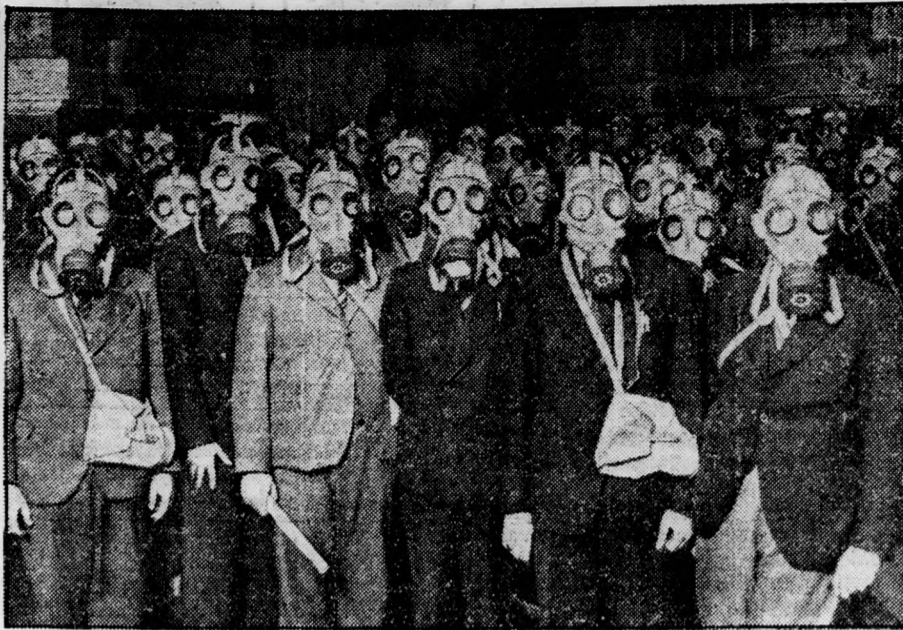
Gázmaszkos gyakorlatok a budapesti mentőknel