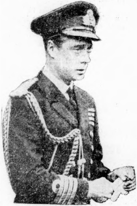
EDWARD windsori herceg

Ausztria felé vette útját, feltámad az a reménység, hogy Magyarországra is eljön, amelyet már két ízben tisztelt meg látogatásával és amely iránt való szeretetének számos bizonyosságát adta. Magyarországot hódolattal, mélyes tisztelettel és