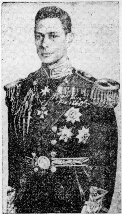
Első felvétel VI. GYÖRGYRŐL, mint királyról

ságára nem juttatnak el hozzá újságokat. Minden vágya az, hogy pihenjen.