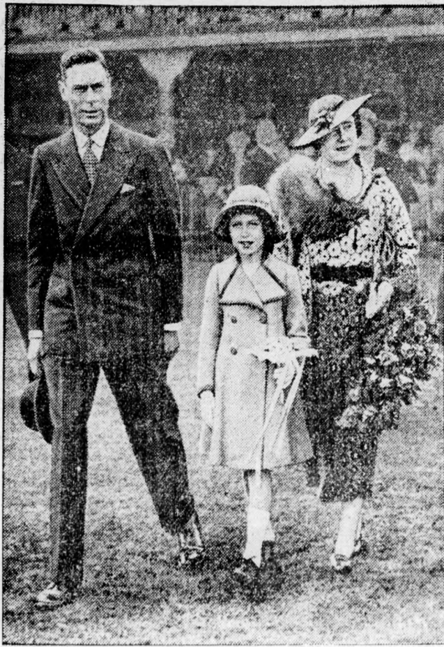
A királyi család

Az angol alsóház előtt így várta a közönség a legújabb híreket